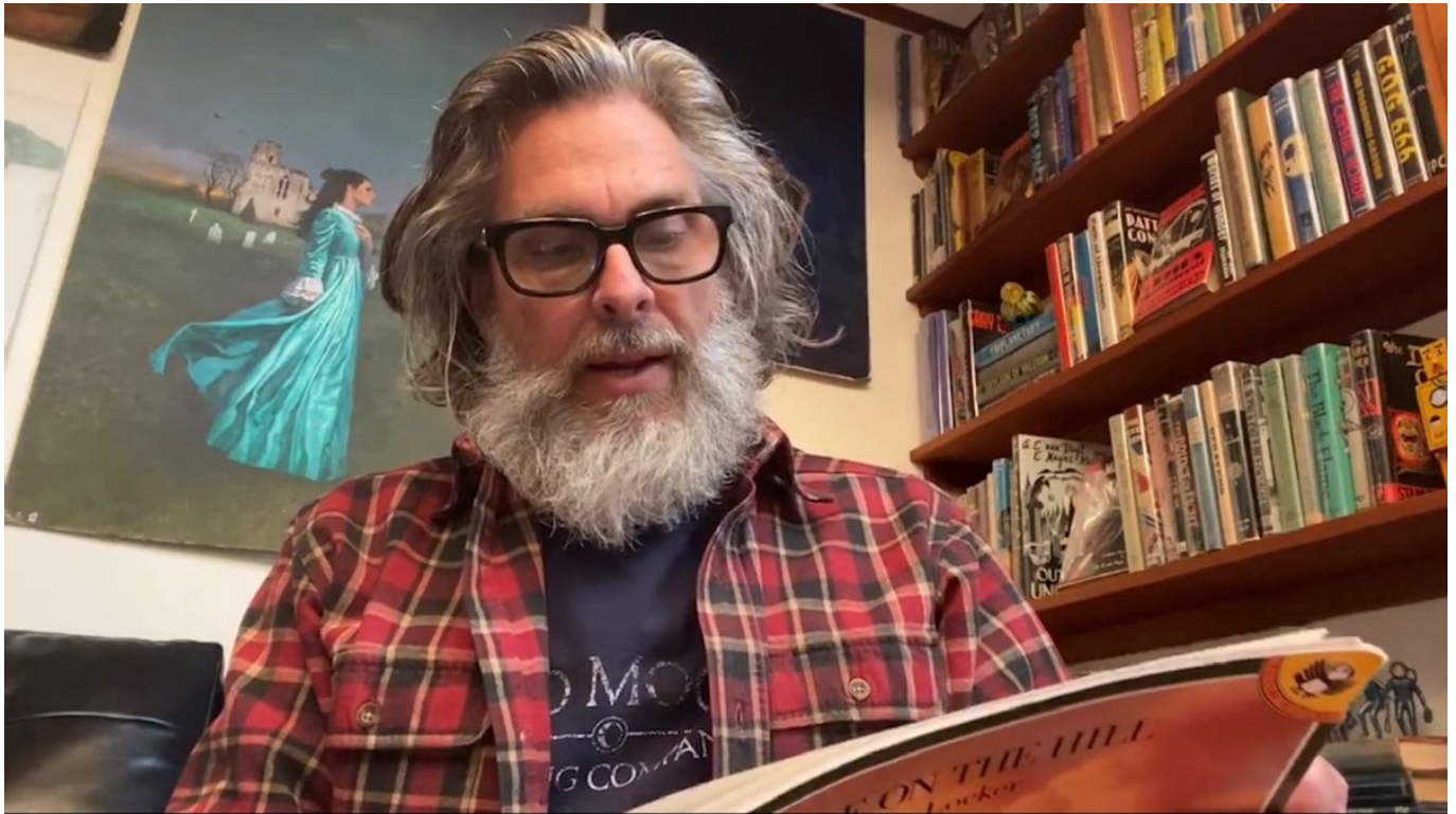
Salah satu penulis buku yang gugat OpenAI

OpenAI belum memberikan tanggapan resmi atas gugatan hukum tersebut. Namun, perusahaan tersebut mengatakan bahwa mereka menghormati hak cipta dan akan membela diri dalam gugatan tersebut.