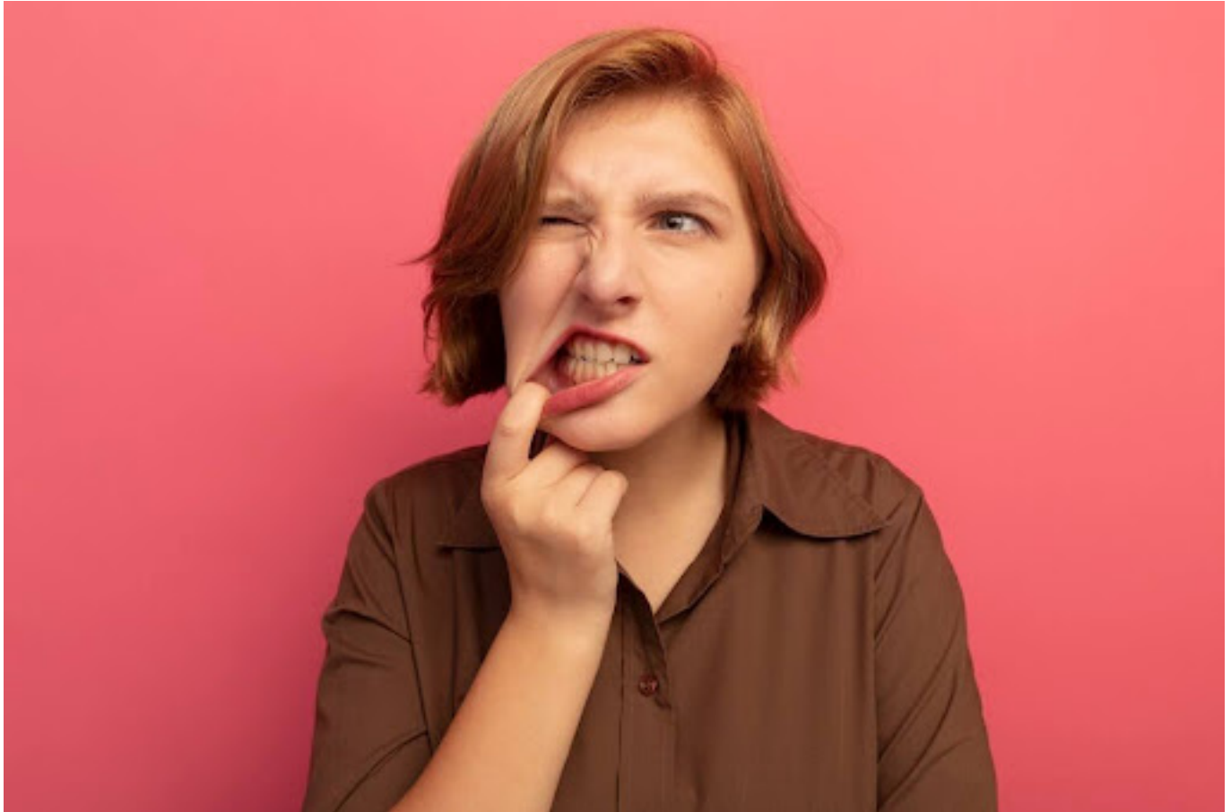
Ilustrasi wanita yang sariawan

Istilah “panas dalam” sebenarnya tidak ada dalam kamus dunia medis. Kondisi ini bukan merupakan suatu penyakit, melainkan kumpulan gejala yang sering muncul bersamaan, seperti sariawan, bibir kering, dan sakit tenggorokan.