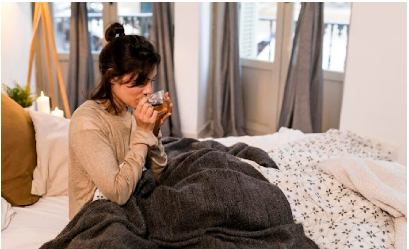
ilustrasi wanita yang meminum teh hangat

Dengan mengetahui penyebab dari panas dalam, kita dapat mengambil langkah-langkah yang tepat untuk mengatasinya. Meskipun sering dianggap remeh, panas dalam sebenarnya dapat mengganggu kenyamanan dan aktivitas sehari-hari kita.