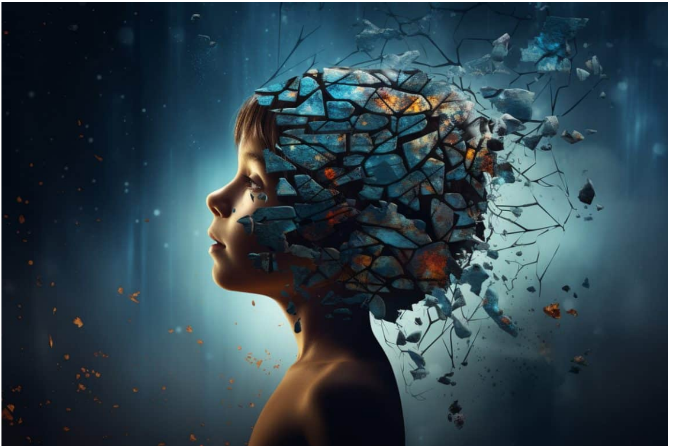
Ilustrasi Healing Trauma

Nah, jawabannya ada di konsep psikologi bernama cognitive distortion alias cara berpikir yang melenceng dan gak realistis. Dua yang paling sering terjadi saat overthinking adalah: