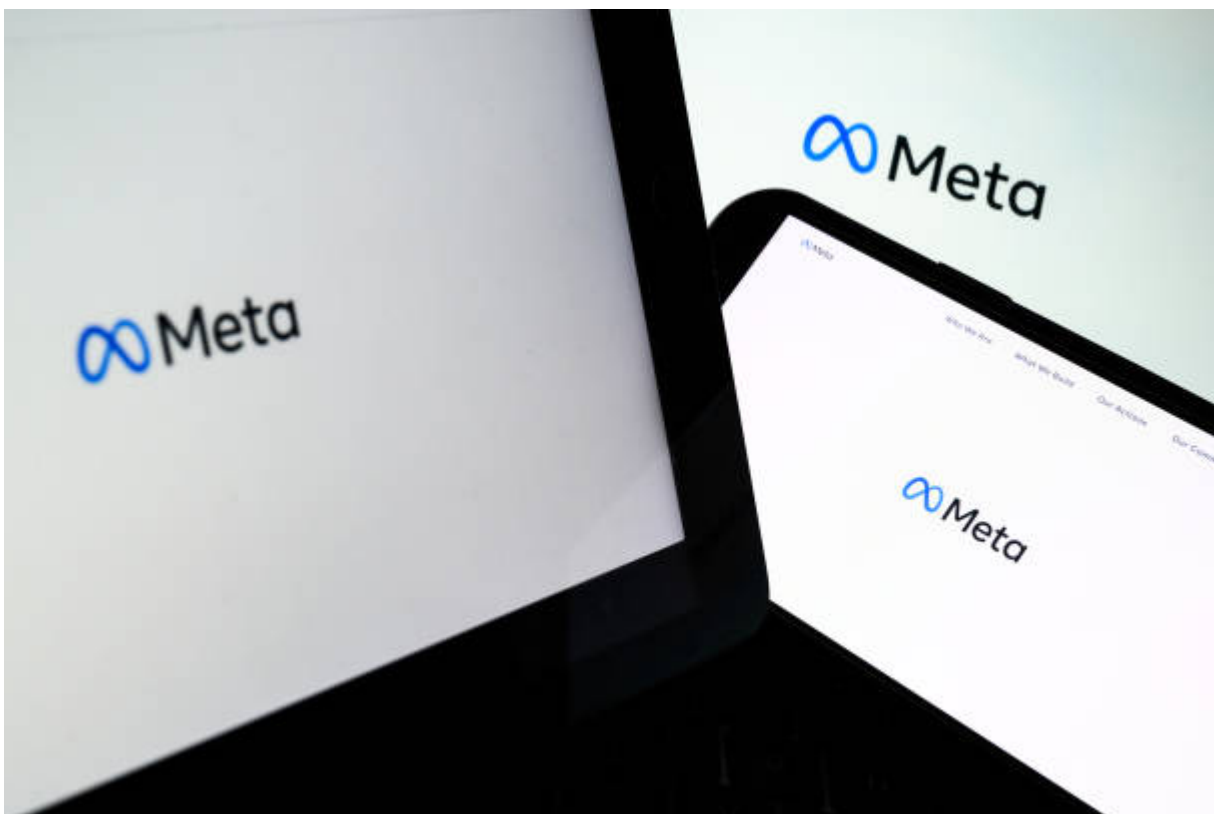
Logo Meta - Leon Neal

Beberapa perusahaan besar sebelumnya telah mencoba merancang prosesor mereka sendiri namun tidak sepenuhnya berhasil.