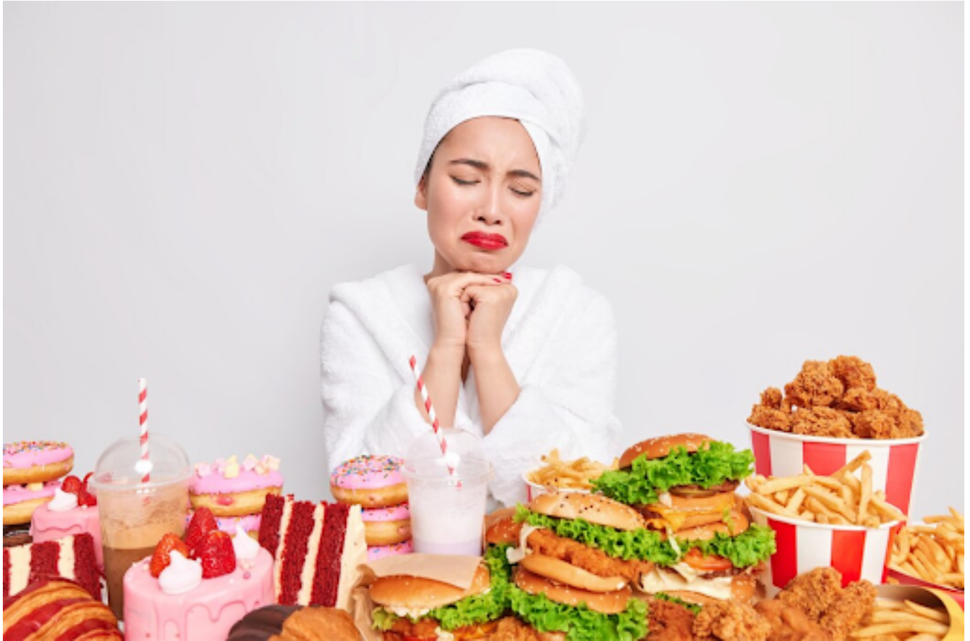
Ilustrasi junkfood

Setiap orang memang unik, termasuk dalam kondisi kesehatannya. Makanya, penting banget untuk konsultasi dengan dokter atau ahli gizi supaya kamu bisa mendapatkan saran diet yang paling tepat sesuai kebutuhan tubuhmu.