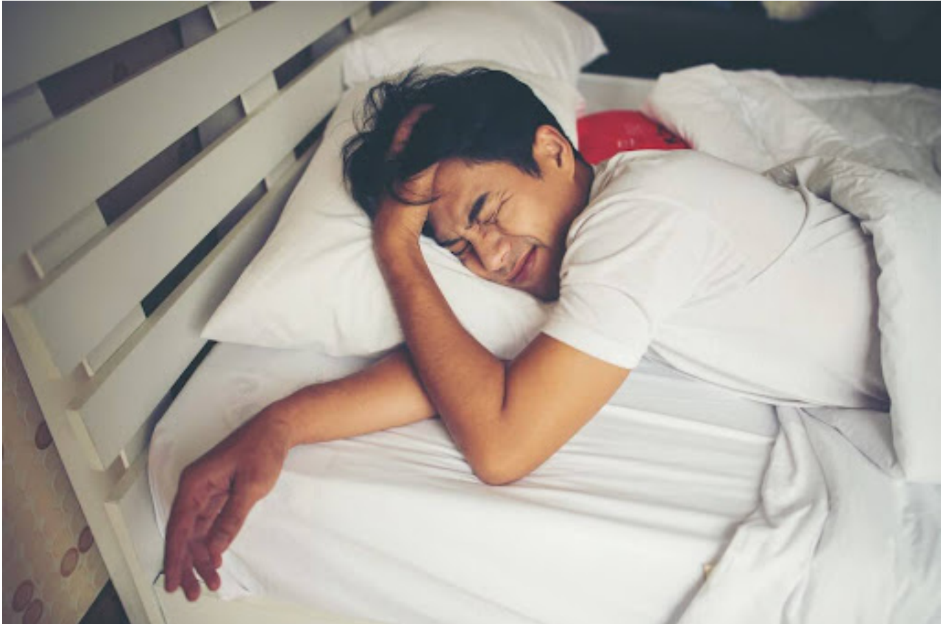
Ilustrasi pria yang tidak tidur nyenyak - Freepik

Stres yang kronis dapat mengganggu pola tidur seseorang, baik itu sulit tidur atau tidur yang tidak nyenyak. Kurangnya istirahat yang cukup dapat membuat seseorang lebih sensitif terhadap rangsangan sekitar dan membuat mereka mudah terkejut.