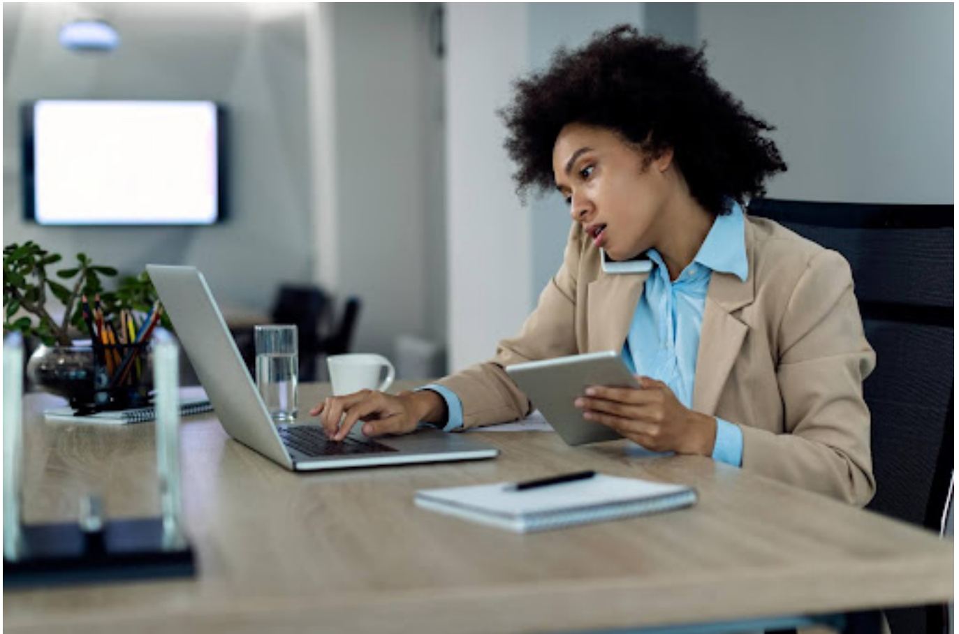
Ilustrasi wanita yang sibuk dengan pekerjaan

Stres berat dapat membuat pikiran seseorang terbagi dan sulit untuk fokus pada satu hal. Sehingga, ketika seseorang sedang dalam kondisi stres, mereka mungkin tidak siap atau tidak dapat memproses informasi dengan cepat, yang dapat menyebabkan mereka merasa mudah terkejut oleh situasi sehari-hari.