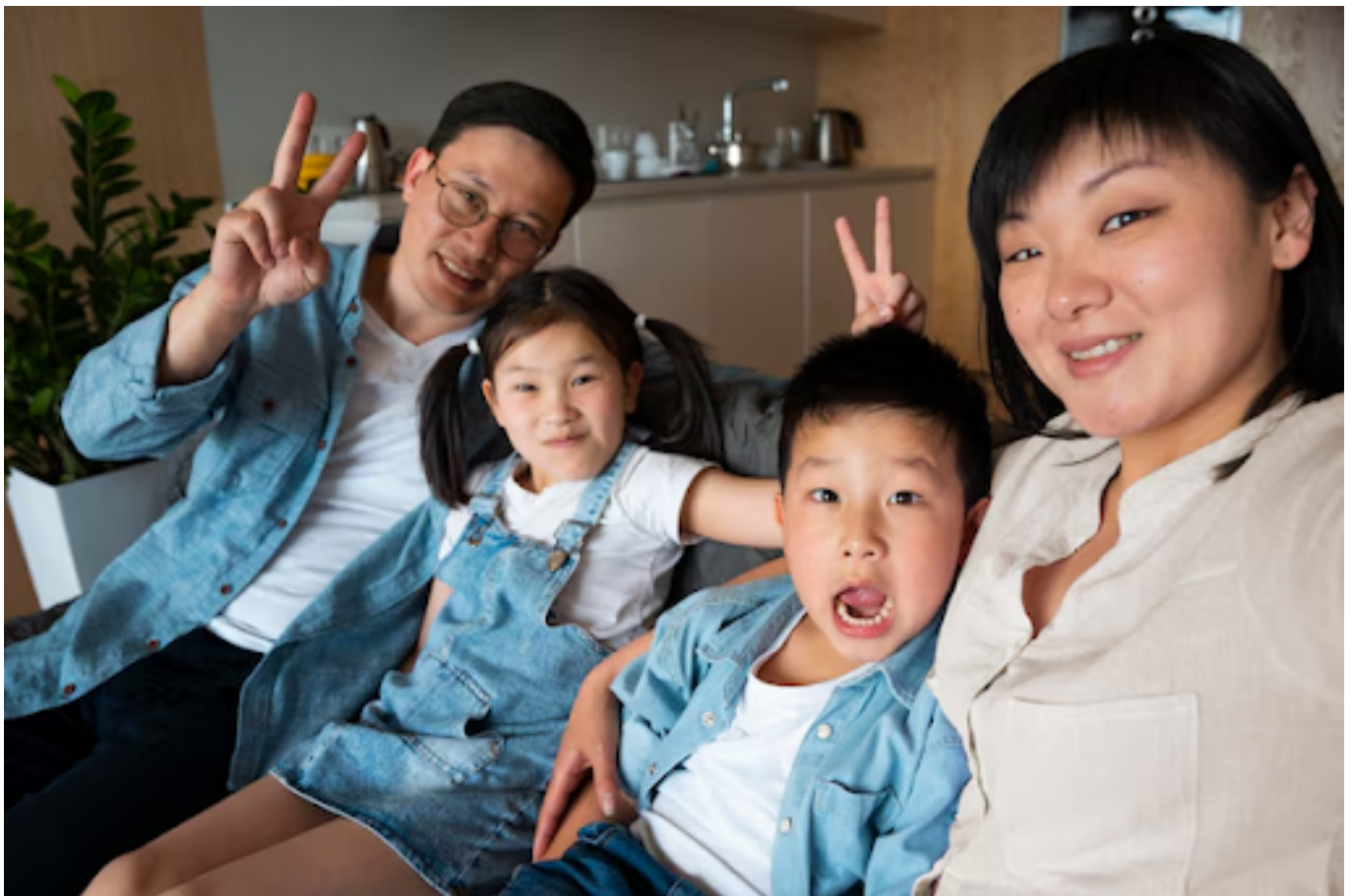
Ilustrasi keluarga kecil

Beberapa orang tua merasa bahwa anak-anak memberikan makna lebih dalam kehidupan mereka dan menjadi motivasi untuk bekerja lebih keras.