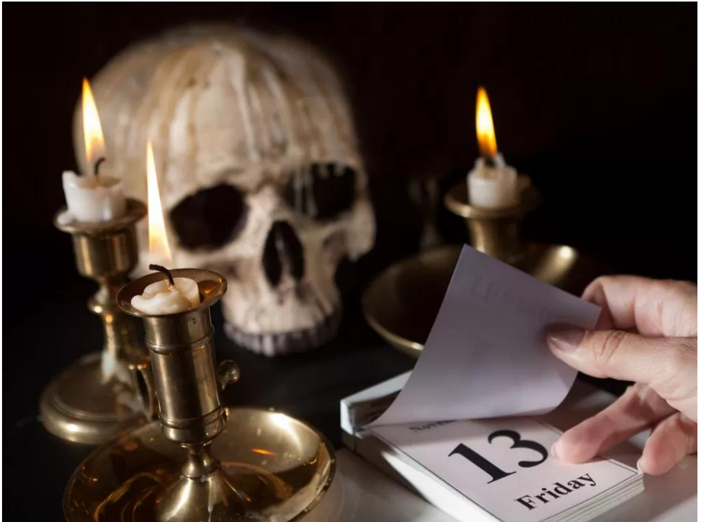
Ilustrasi - Lens Monash

Bukan rahasia lagi bahwa Friday the 13th sering kali dikaitkan dengan berbagai peristiwa tragis dan kesialan. Beberapa contoh kejadian yang dikaitkan dengan mitos Jumat tanggal 13 yang dianggap sebagai hari sial adalah: