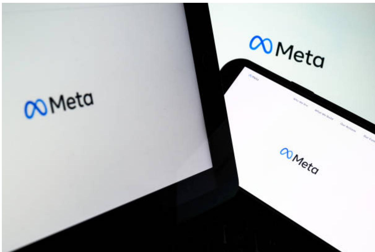
Beberapa perangkat yang memiliki Logo Meta di layarnya

Rilis chatbot AI yang dirancang khusus untuk pengguna muda dapat berdampak signifikan pada lanskap media sosial.