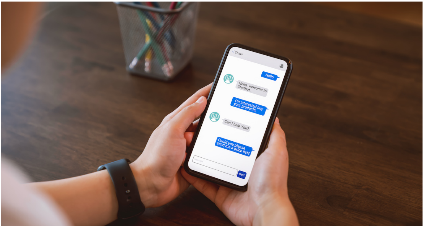
Ilustrasi pengguna muda - chatdesk

Seperti disebutkan di atas, chatbot AI memiliki potensi untuk menawarkan sejumlah manfaat bagi pengguna muda. Misalnya, dapat digunakan untuk: