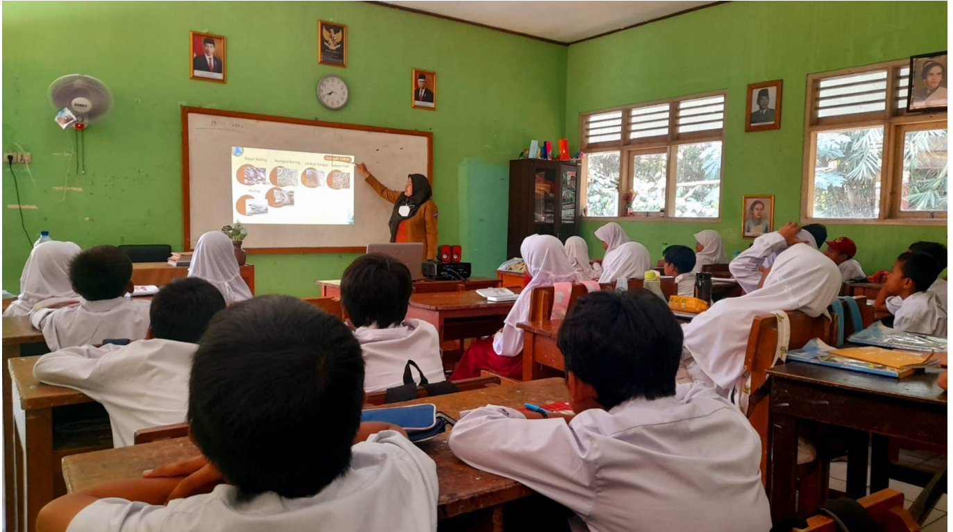
Potret guru sedang mengajar di kelas