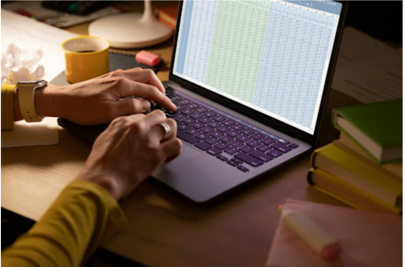
Ilustrasi mengolah data di laptop

Menguasai rumus dasar Microsoft Excel bukan hanya membantu mempermudah pekerjaan sehari-hari, tetapi juga meningkatkan daya saing di pasar kerja.