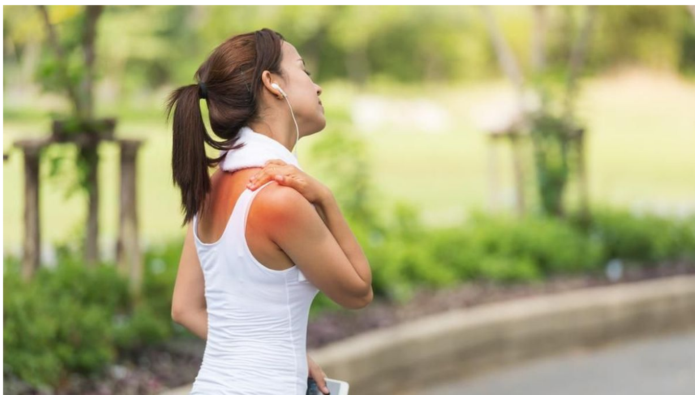
Ilustrasi nyeri otot

Koyo memiliki beberapa manfaat, antara lain: