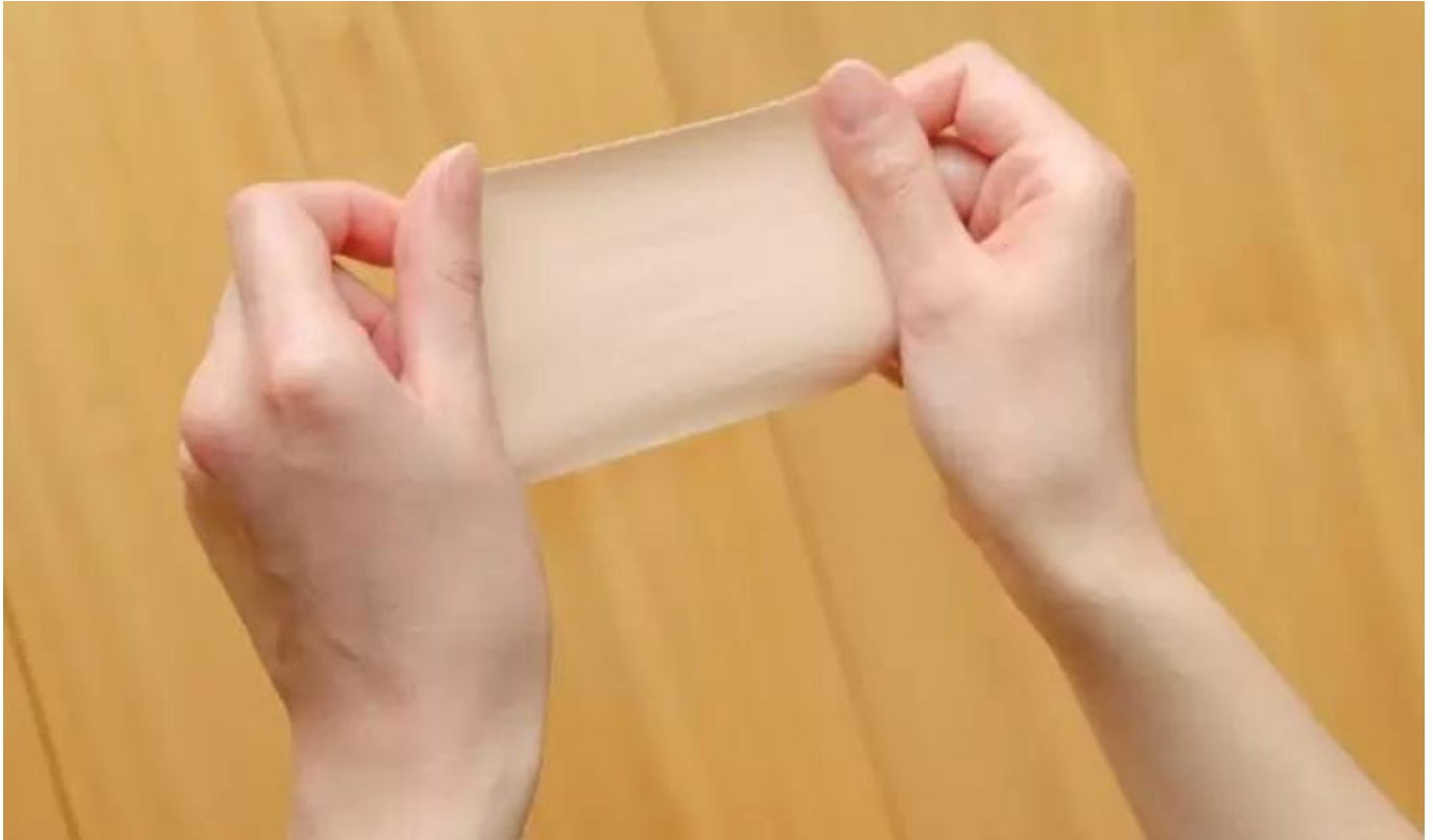
Ilustrasi patch penahan nyeri

Berikut adalah langkah-langkah menggunakan patch penahan nyeri dengan benar untuk menghindari iritasi kulit: