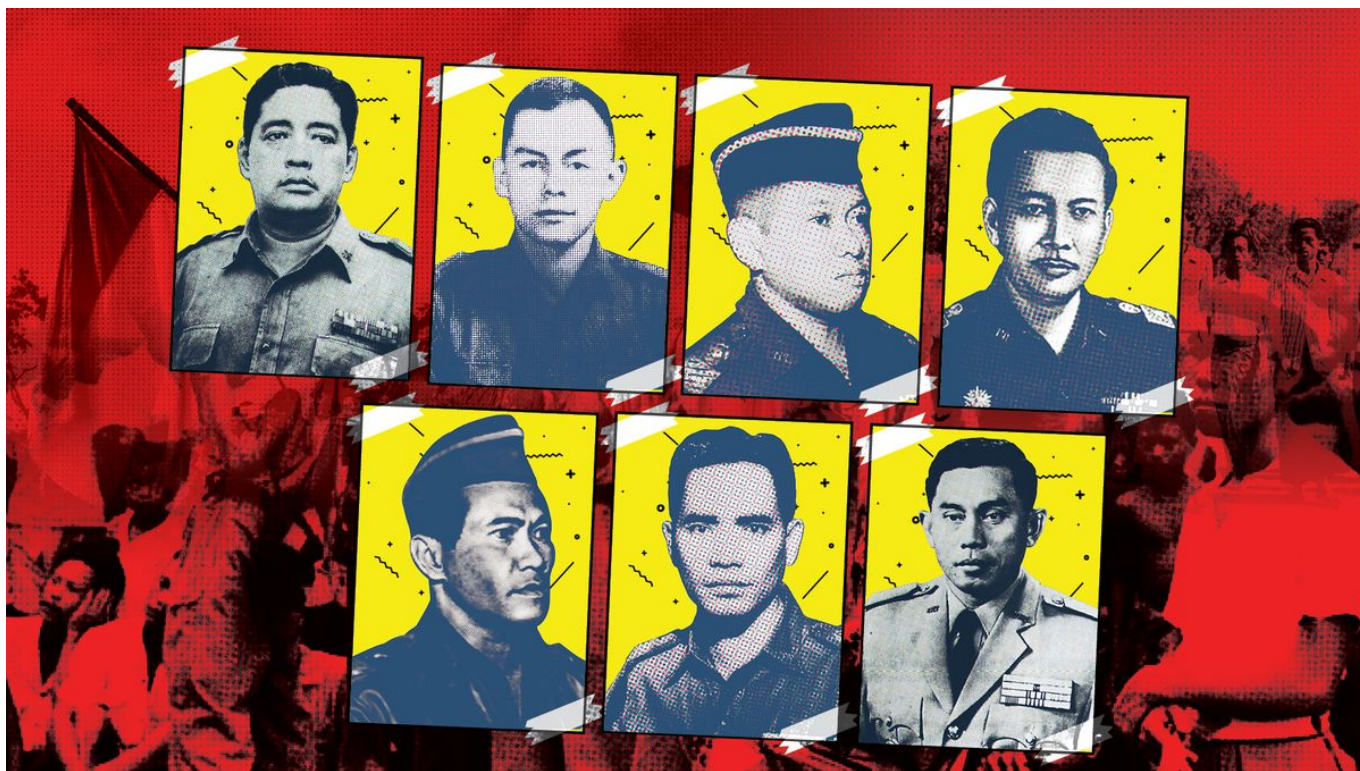
Enam Jenderal dan Satu Perwira