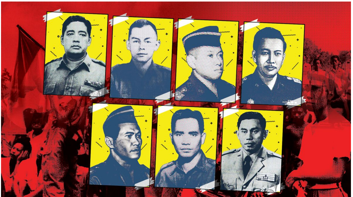
Enam Jenderal dan Satu Perwira - detik.com