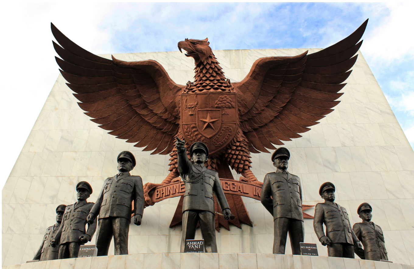
Potret Monumen Pancasila Sakti yang mengenang Tragedi G30S PKI

Kejadian G30S PKI bukanlah sekadar cerita lama yang dapat dilupakan begitu saja. Kejadian tersebut memberikan pelajaran berharga bagi Indonesia tentang pentingnya menjaga keutuhan bangsa dari ancaman pihak-pihak yang ingin menggoyahkan stabilitas negara.