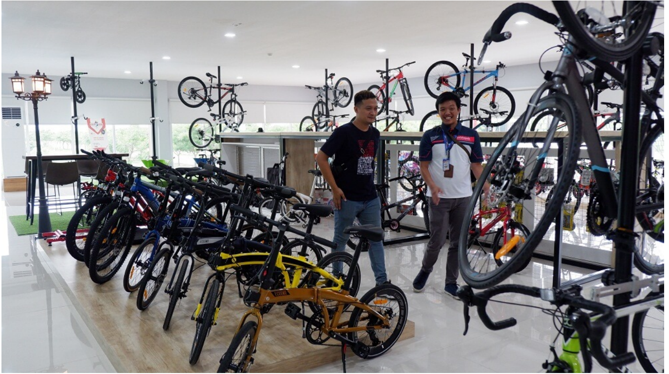
Ilustrasi penjualan sepeda

Peningkatan penjualan sepeda ini juga telah mendukung pertumbuhan industri sepeda di Indonesia, dengan banyak orang mencari sepeda baru atau bahkan mulai bersepeda setelah lama tidak melakukannya.