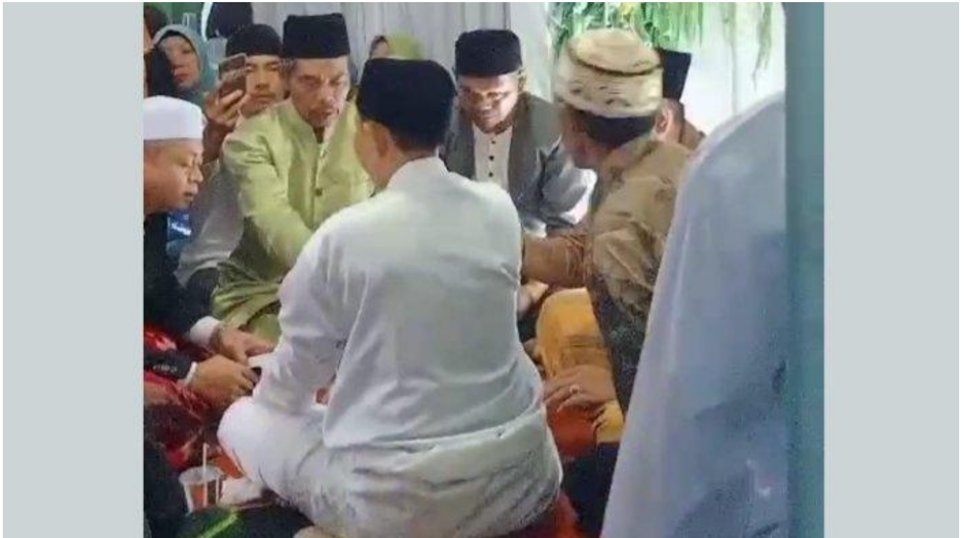
Dok Kepala Desa