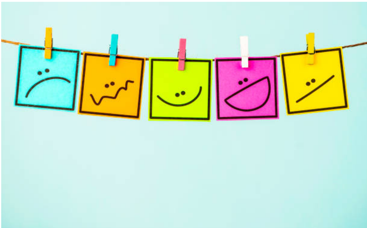
Ilustrasi berbagai emosi - CatLane