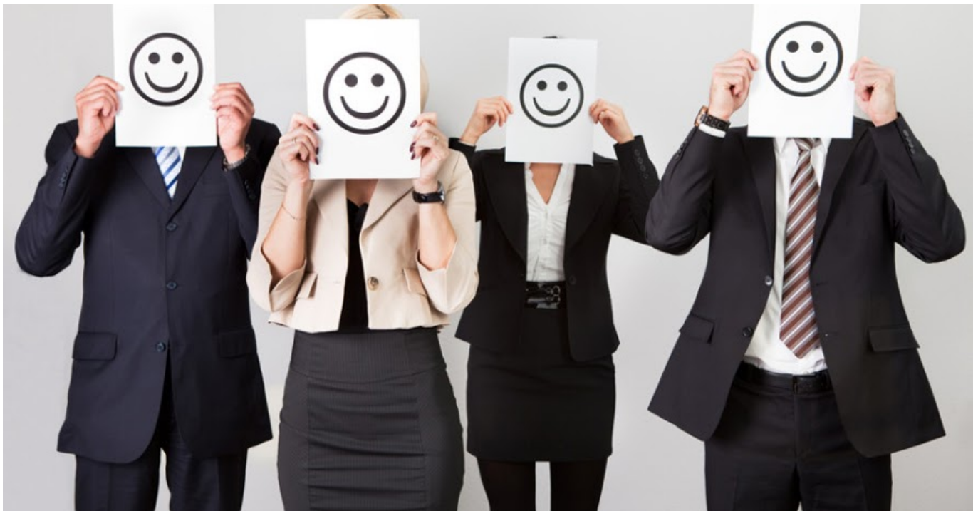
Ilustrasi - Jojonomic

Reaksi tubuh berupa jantung berdebar kencang, mungkin teriakan kecil, otot tegang secara tiba-tiba.