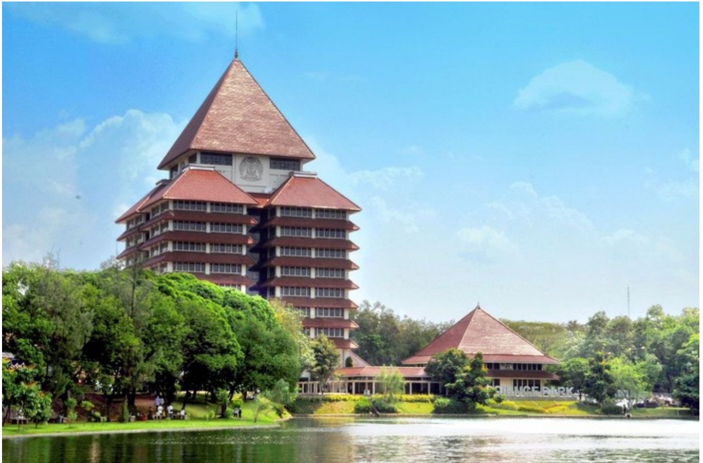
Kampus UI Depok

Universitas Indonesia membuka jalur mandiri tanpa nilai UTBK SNBT 2023 melalui Seleksi Masuk Universitas Indonesia (SIMAK UI). Seleksi ini dibuka untuk jenjang S1, S1 Kelas Internasional, Vokasi, Profesi, RPL, Magister, dan Doktor. Adapun pendaftaran SIMAK UI dibuka mulai dari 6 Juni hingga 6 Juli 2023.