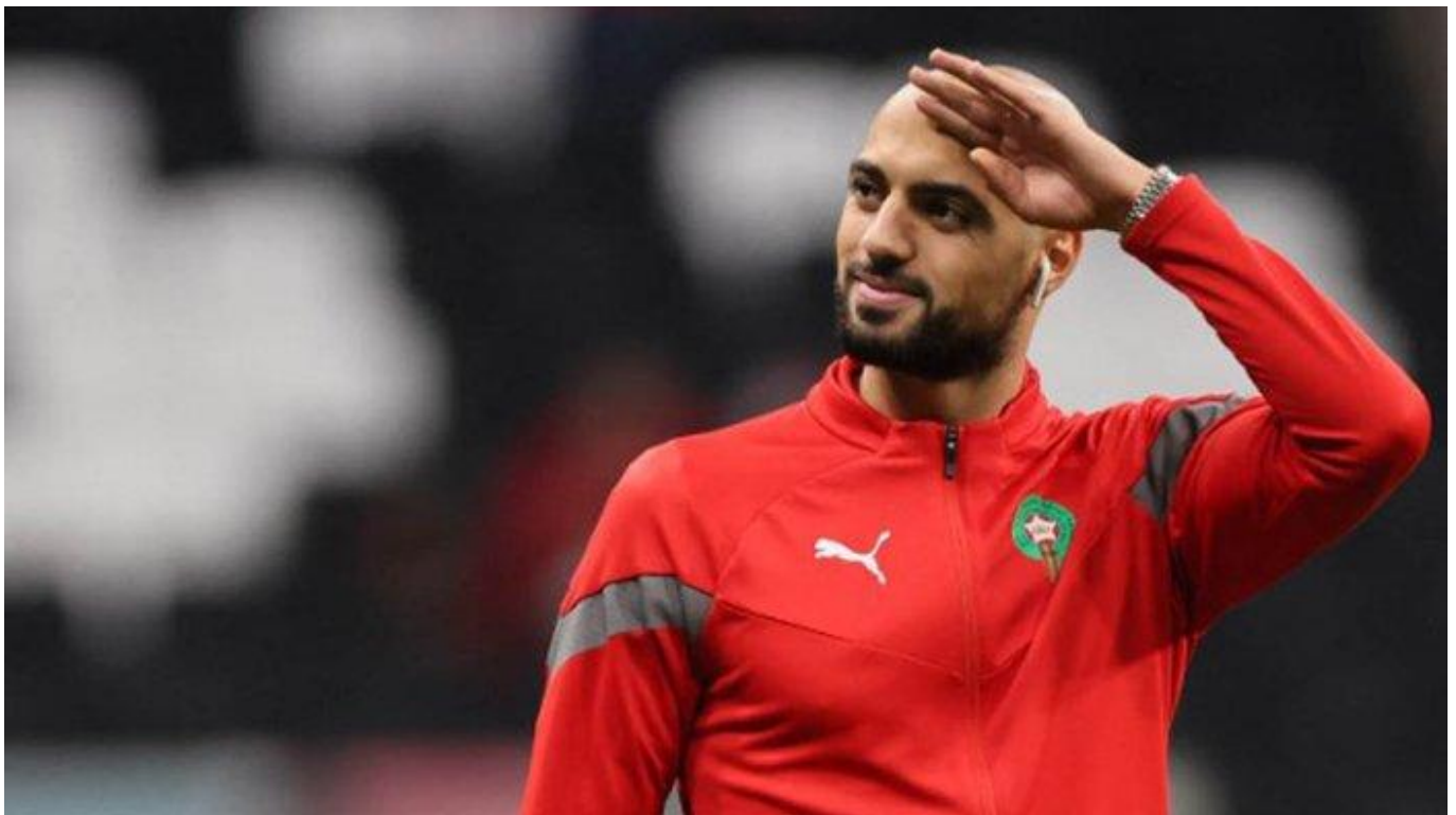
Sofyan Amrabat

Namun, kesepakatan untuk Cucurella gagal terwujud karena Chelsea tidak bersedia menyertakan klausul pembatalan seperti yang diminta oleh Tottenham pada transfer Sergio Reguilon.