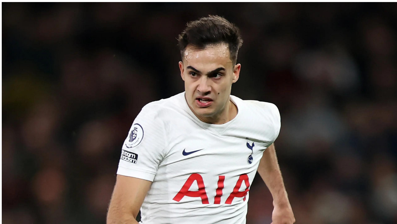
Sergio Reguilon

Manchester United hanya akan meminjam jasanya selama satu musim tanpa biaya peminjaman atau opsi pembelian permanen.