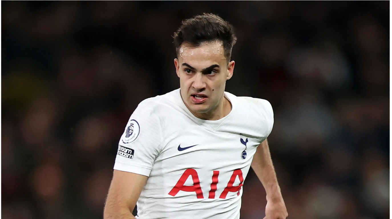
Sergio Reguilon

Manchester United hanya akan meminjam jasanya selama satu musim tanpa biaya peminjaman atau opsi pembelian permanen.