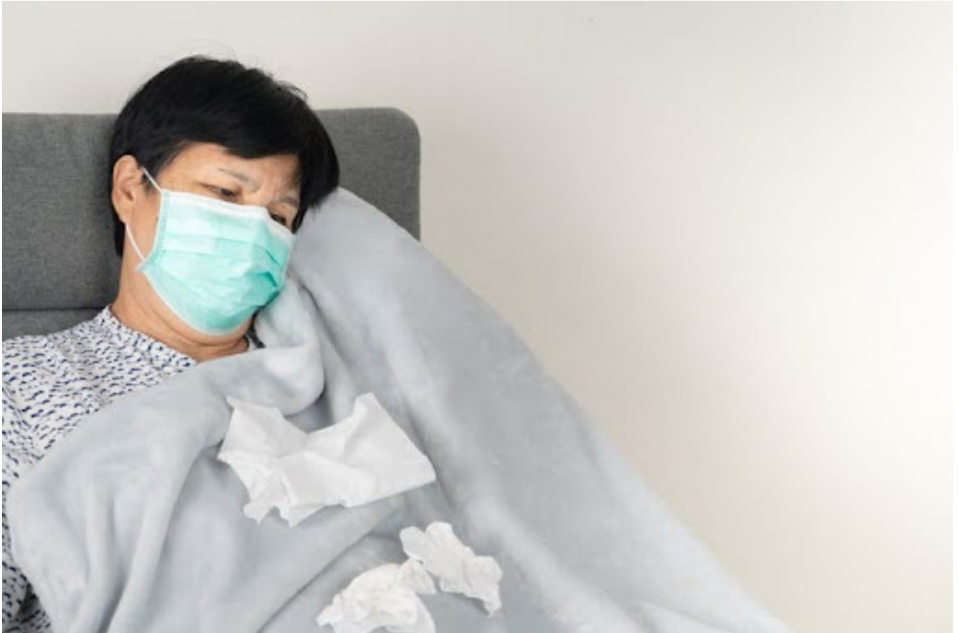
Ilustrasi pria yang sedang sakit

“ Man Flu ” bukanlah istilah medis yang resmi. Ini lebih merupakan istilah informal yang digunakan untuk menggambarkan reaksi berlebihan pria terhadap gejala flu atau penyakit ringan.