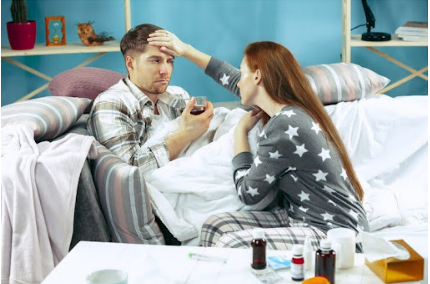
Ilustrasi pria sakit yang dirawat