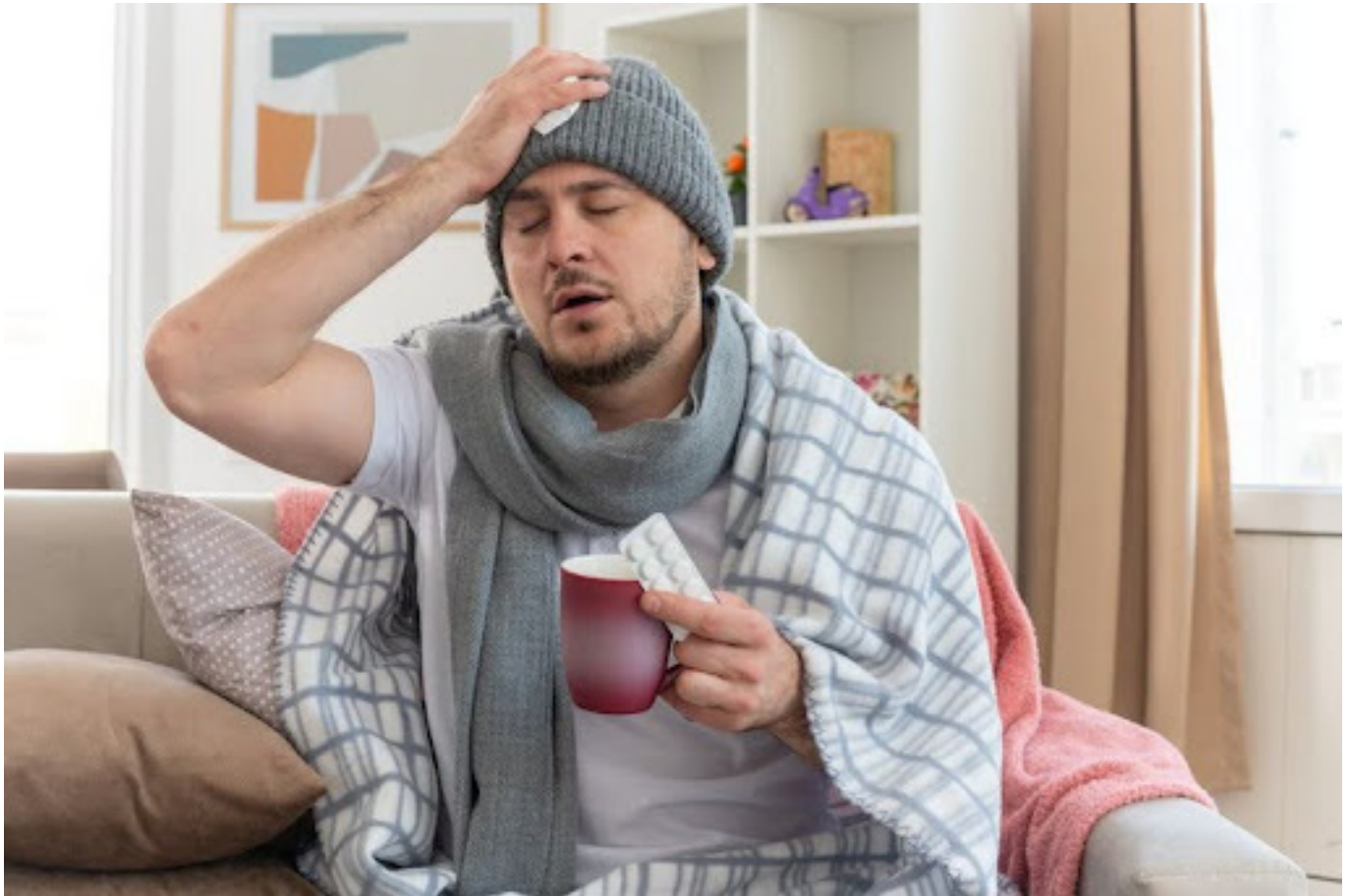
Ilustrasi Pria yang sedang sakit

Meskipun istilah “man flu” sering dianggap hanya sebagai lelucon, ternyata ada beberapa alasan ilmiah—baik dari segi fisik maupun psikologis—yang bisa menjelaskan mengapa pria sering kali terlihat lebih “lebay” saat sakit.