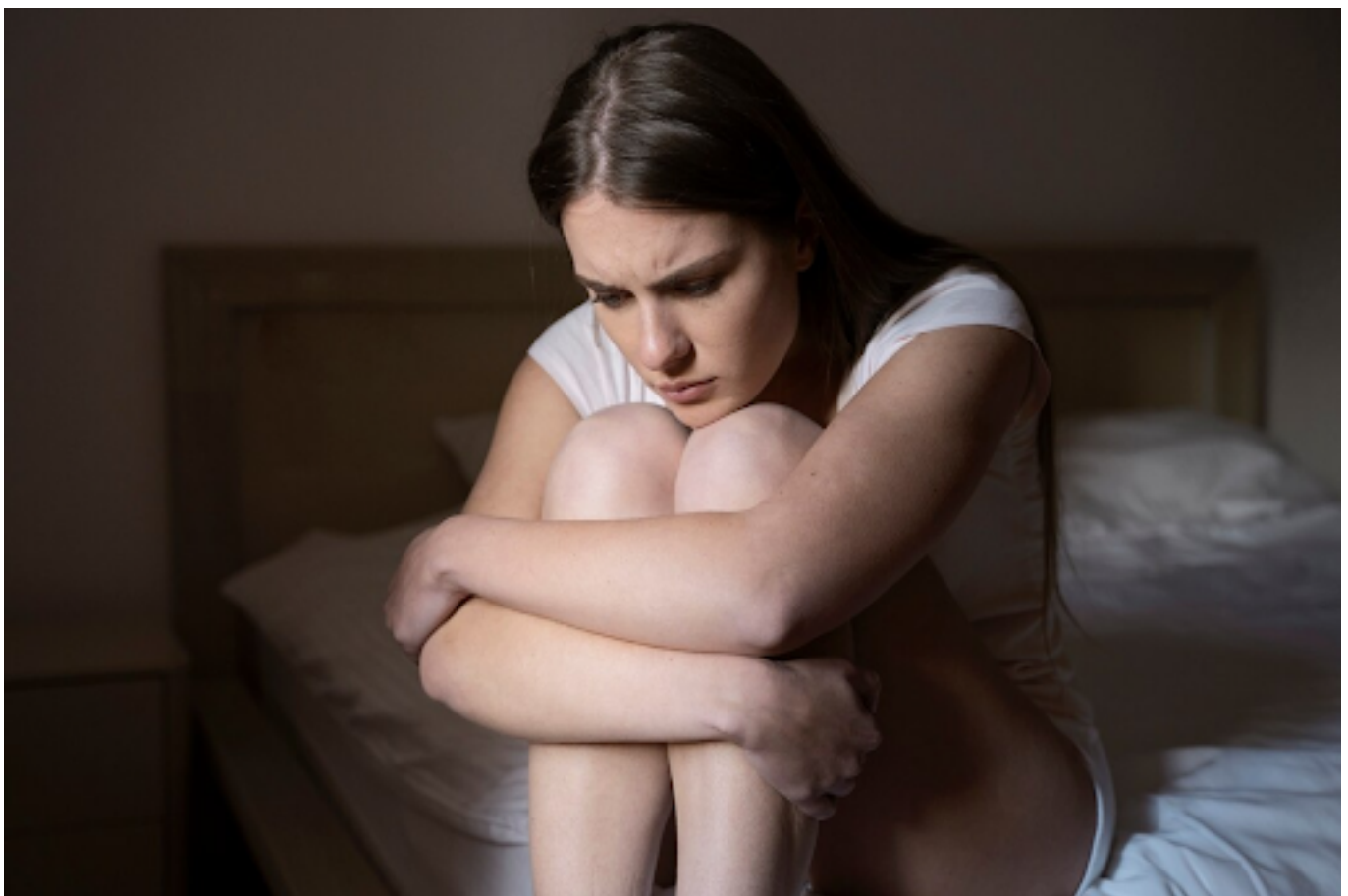
Ilustrasi wanita yang murung

Kalau kamu merasa sering meragukan diri, mungkin kamu mengalami beberapa ciri berikut ini: