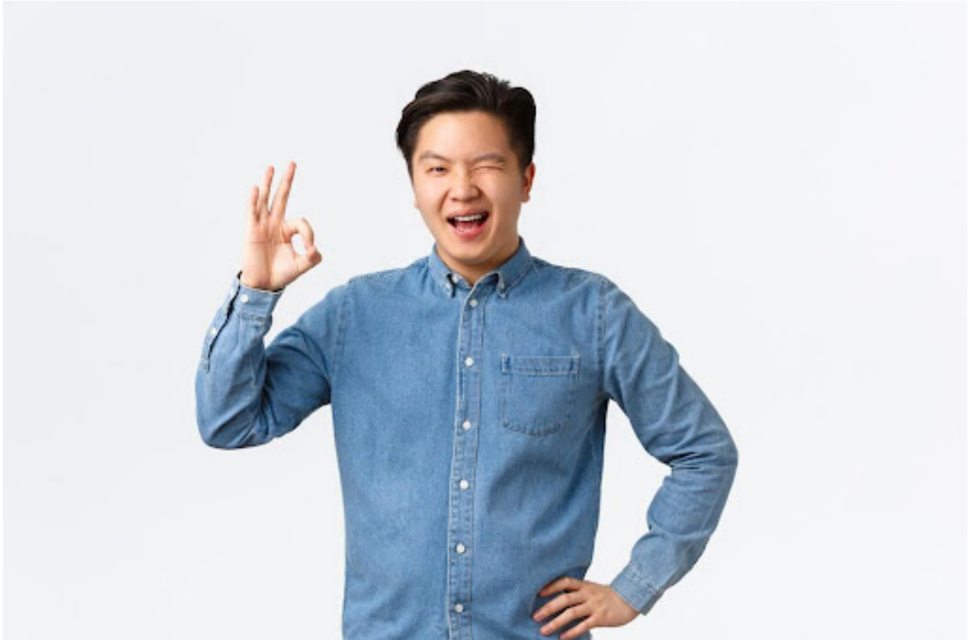
Ilustrasi pria yang percaya diri

Sekarang, gimana caranya untuk keluar dari lingkaran low self-esteem ? Berikut beberapa langkah praktis yang bisa kamu coba: