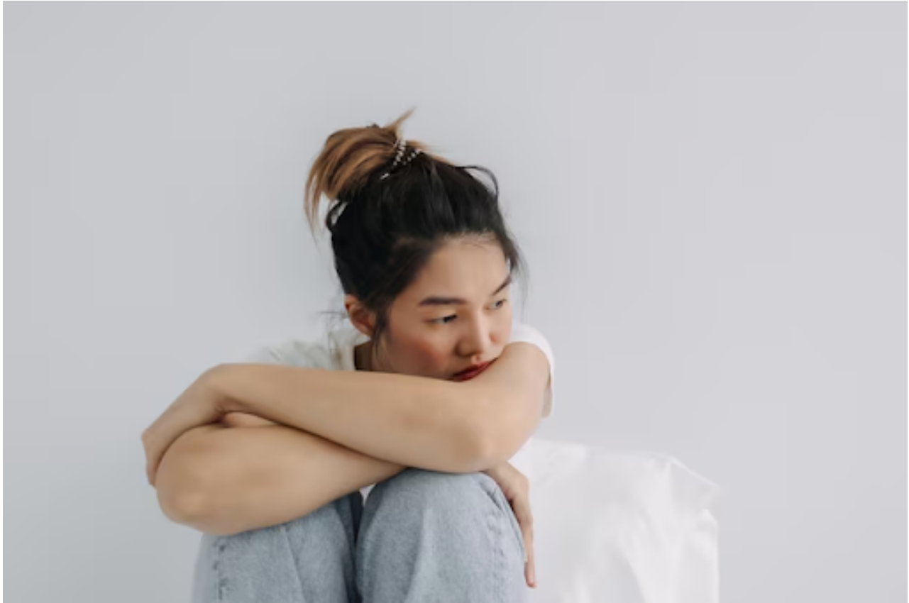
Ilustrasi wanita yang murung

Low self-esteem atau rasa percaya diri yang rendah adalah kondisi di mana seseorang merasa dirinya nggak berharga atau merasa bahwa dirinya nggak cukup baik dibandingkan orang lain.