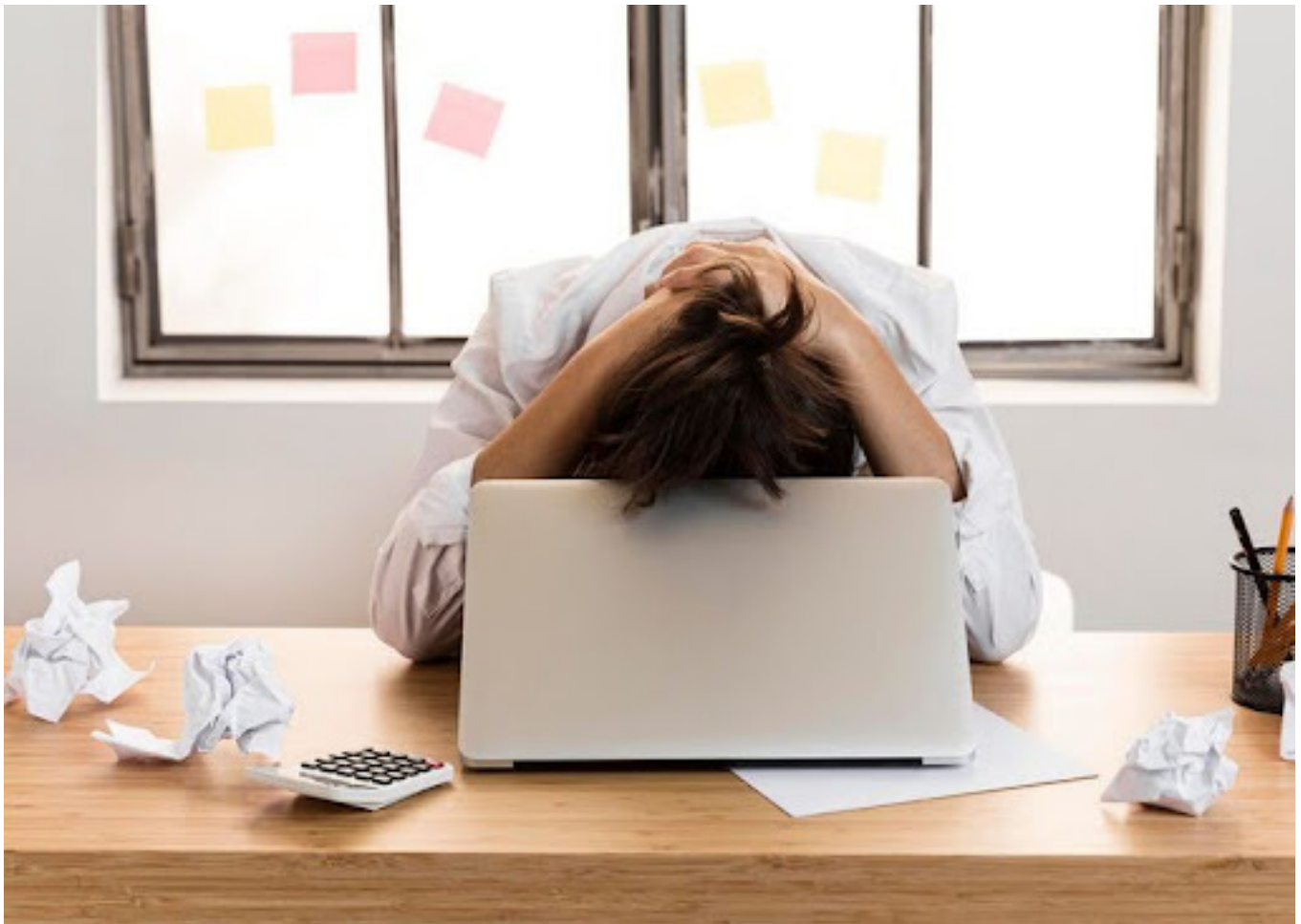
Ilustrasi wanita yang jenuh dengan pekerjaannya

Low self-esteem nggak cuma bikin kita merasa nggak nyaman secara emosional, tapi juga bisa berdampak pada berbagai aspek kehidupan. Berikut 5 dampak negatifnya: