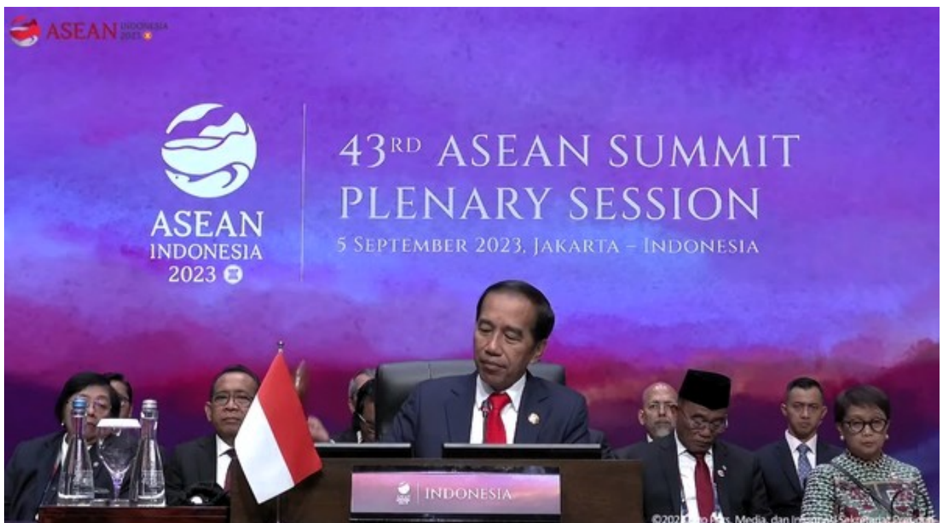
Presiden Jokowi menyampaikan pidato pembuka.

Dikutip dari E-book ASEAN Indonesia 2023 pada situs resmi ASEAN 2023, rangkaian acara KTT ASEAN ke-43 Tahun 2023 di Jakarta berlangsung pada 2-7 September 2023.