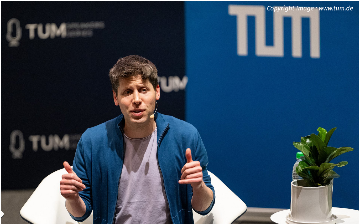
Sam Altman - imigrasi.go

Dia percaya bahwa kombinasi antara perangkat keras yang tepat dengan software yang canggih adalah kunci untuk mewujudkan potensi penuh AI.