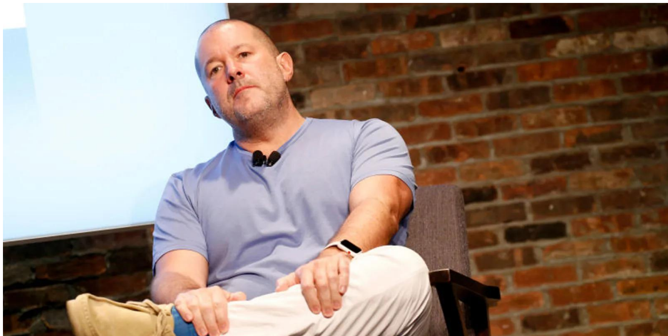
Jony Ive

Meskipun detail spesifik tentang proyek tersebut masih dirahasiakan, kedua pemimpin ini membagikan pandangan mereka tentang bagaimana AI dapat menjadi lebih bermanfaat dan dapat diakses oleh masyarakat luas.