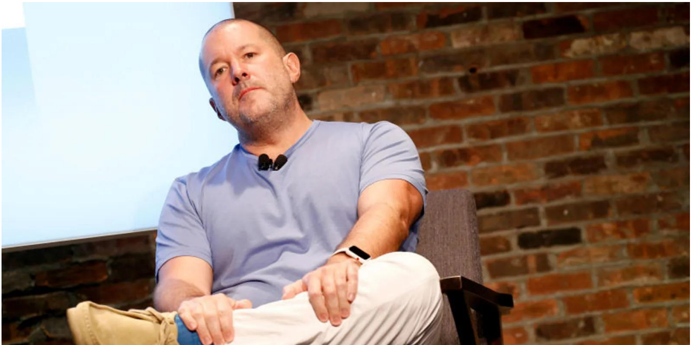
Jony Ive

Meskipun detail spesifik tentang proyek tersebut masih dirahasiakan, kedua pemimpin ini membagikan pandangan mereka tentang bagaimana AI dapat menjadi lebih bermanfaat dan dapat diakses oleh masyarakat luas.