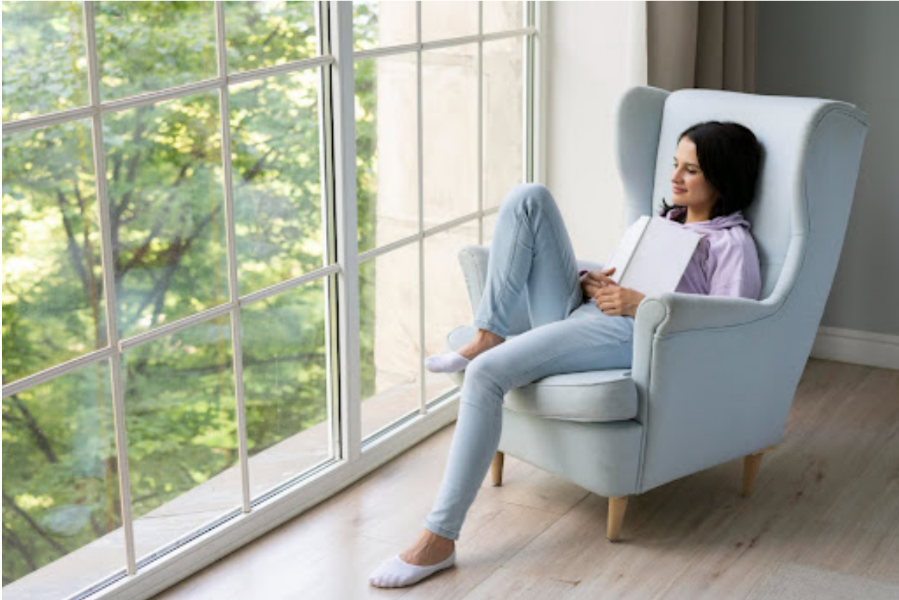
Ilustrasi menikmati waktu sendiri dirumah dengan membaca

Siapa bilang sendirian itu membosankan? Justru saat sendirian, kita bisa menemukan banyak hal baru tentang diri kita sendiri. Mulai dari hobi yang belum sempat kita tekuni, hingga impian yang selama ini hanya terpendam.