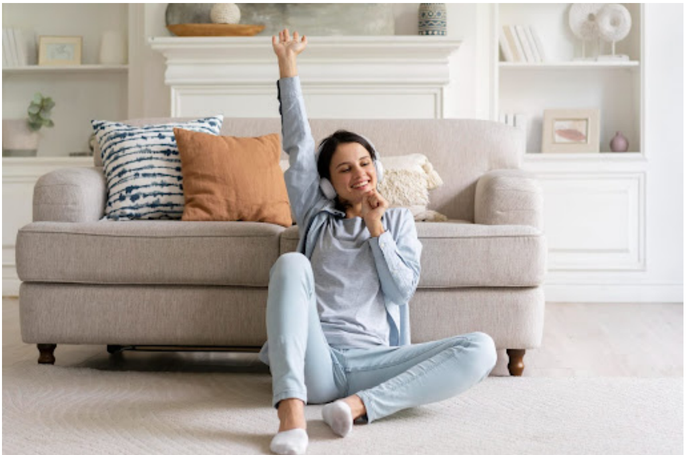
Ilustrasi menikmati waktu sendirian dengan mendengarkan musik - Freepik