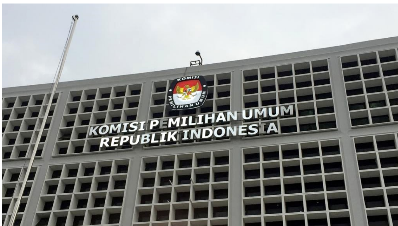
Gedung Komisi Pemilihan Umum Republik Inodnesia

Hasyim menjelaskan bahwa sistem yang dimiliki oleh Komisi Pemilihan Umum RI memantau dengan cermat setiap unggahan formulir C dan konversinya.