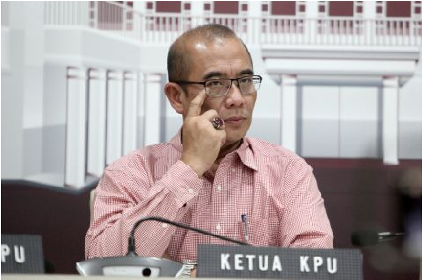
Ketua KPU Hasyim Asy'ari

Hasyim menegaskan bahwa KPU tidak memiliki niat ataupun tindakan untuk memanipulasi hasil penghitungan suara, terutama ketika terjadi kesalahan konversi angka dari Formulir C ke dalam Sistem Informasi Rekapitulasi (Sirekap).