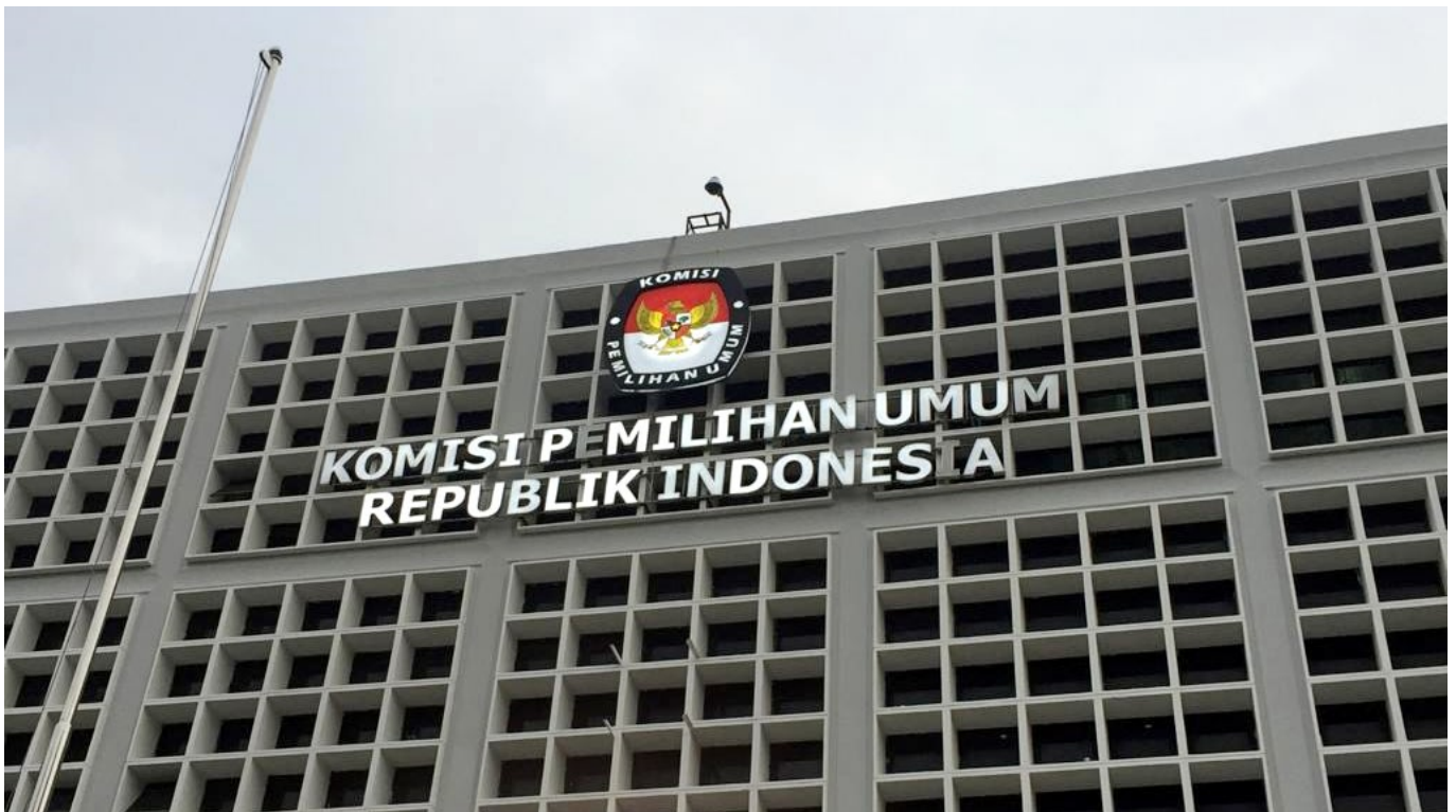
Gedung Komisi Pemilihan Umum Republik Inodnesia - lensakini

Hasyim menjelaskan bahwa sistem yang dimiliki oleh Komisi Pemilihan Umum RI memantau dengan cermat setiap unggahan formulir C dan konversinya.