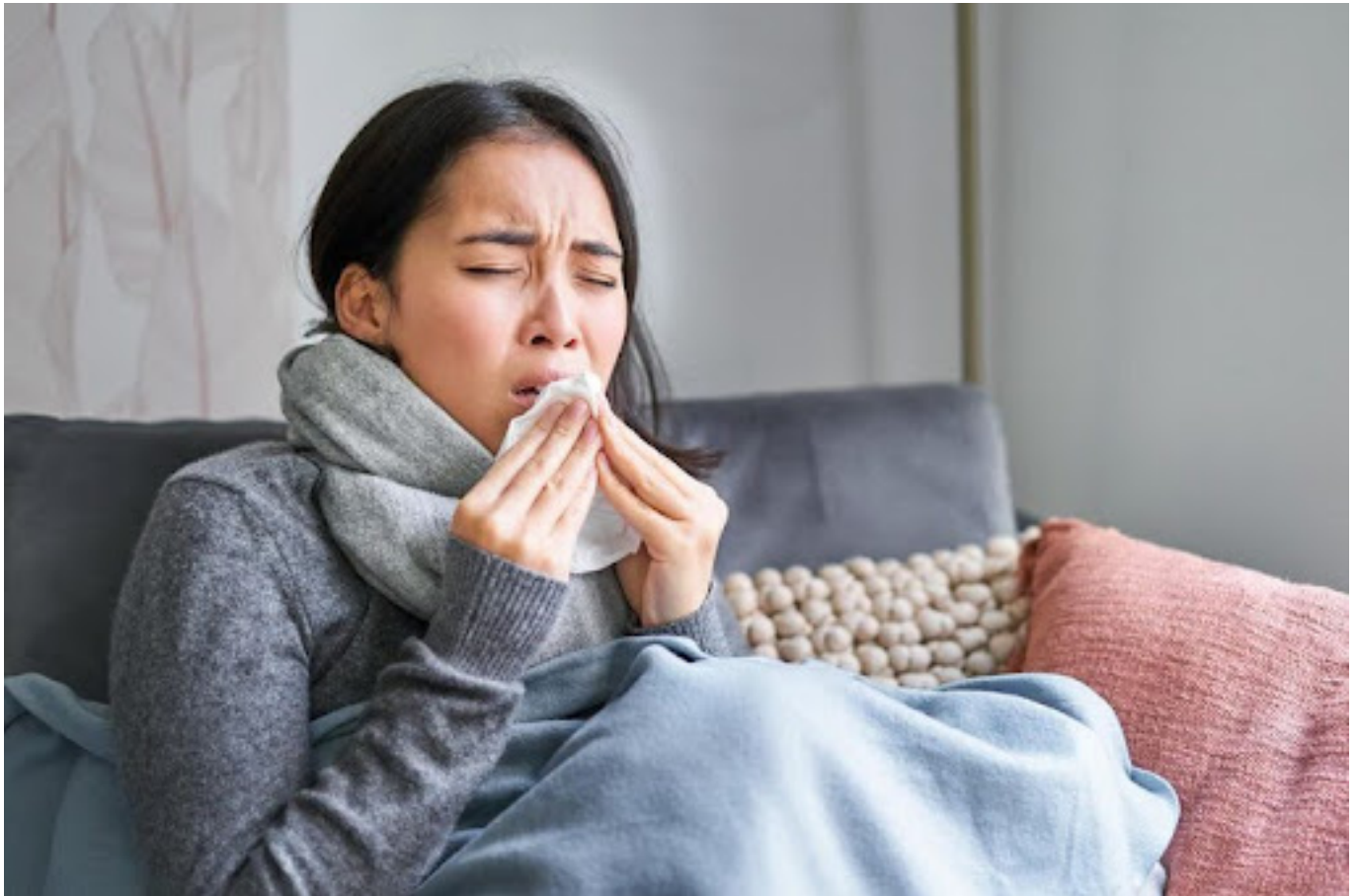
Wanita yang sedang mengalami flu

Dalam beberapa kasus, flu dapat menyebabkan gejala yang lebih parah, seperti sesak napas, nyeri dada, atau muntah-muntah. Jika Kamu mengalami gejala-gejala ini, segera periksa ke dokter.