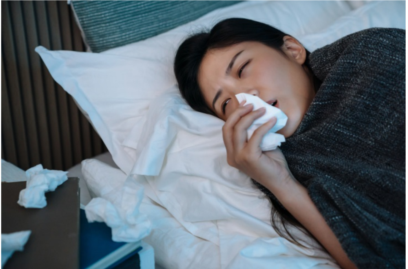
Ilustrasi flu

Gejala flu dapat muncul secara tiba-tiba, dengan variasi ringan hingga berat. Beberapa gejala yang sering muncul antara lain: