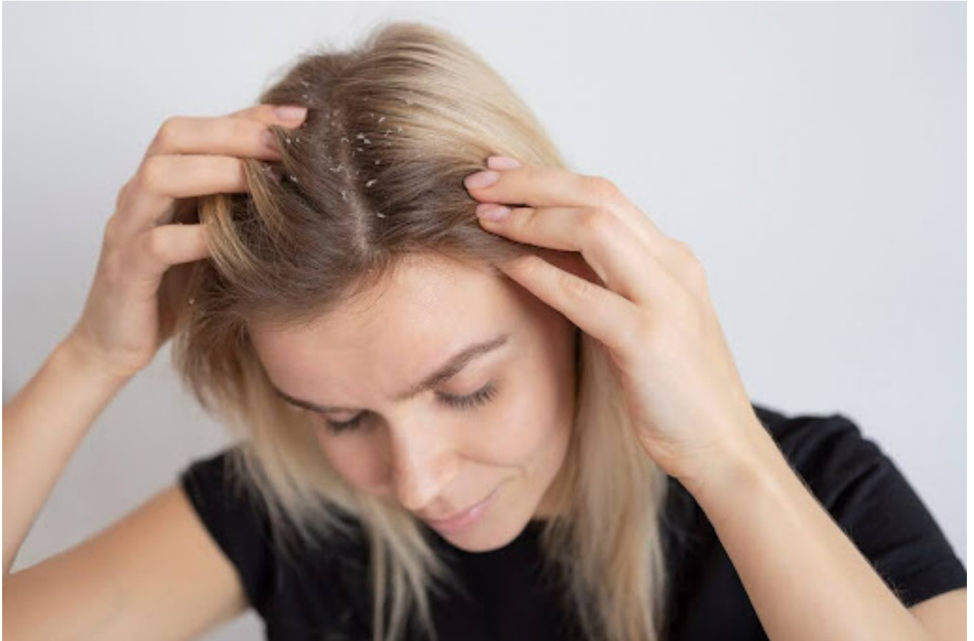
ilustrasi rambut berketombe

Rambut berketombe memang bisa bikin risih dan mengganggu kepercayaan diri. Beberapa gejala ketombe yang perlu kamu waspadai antara lain: