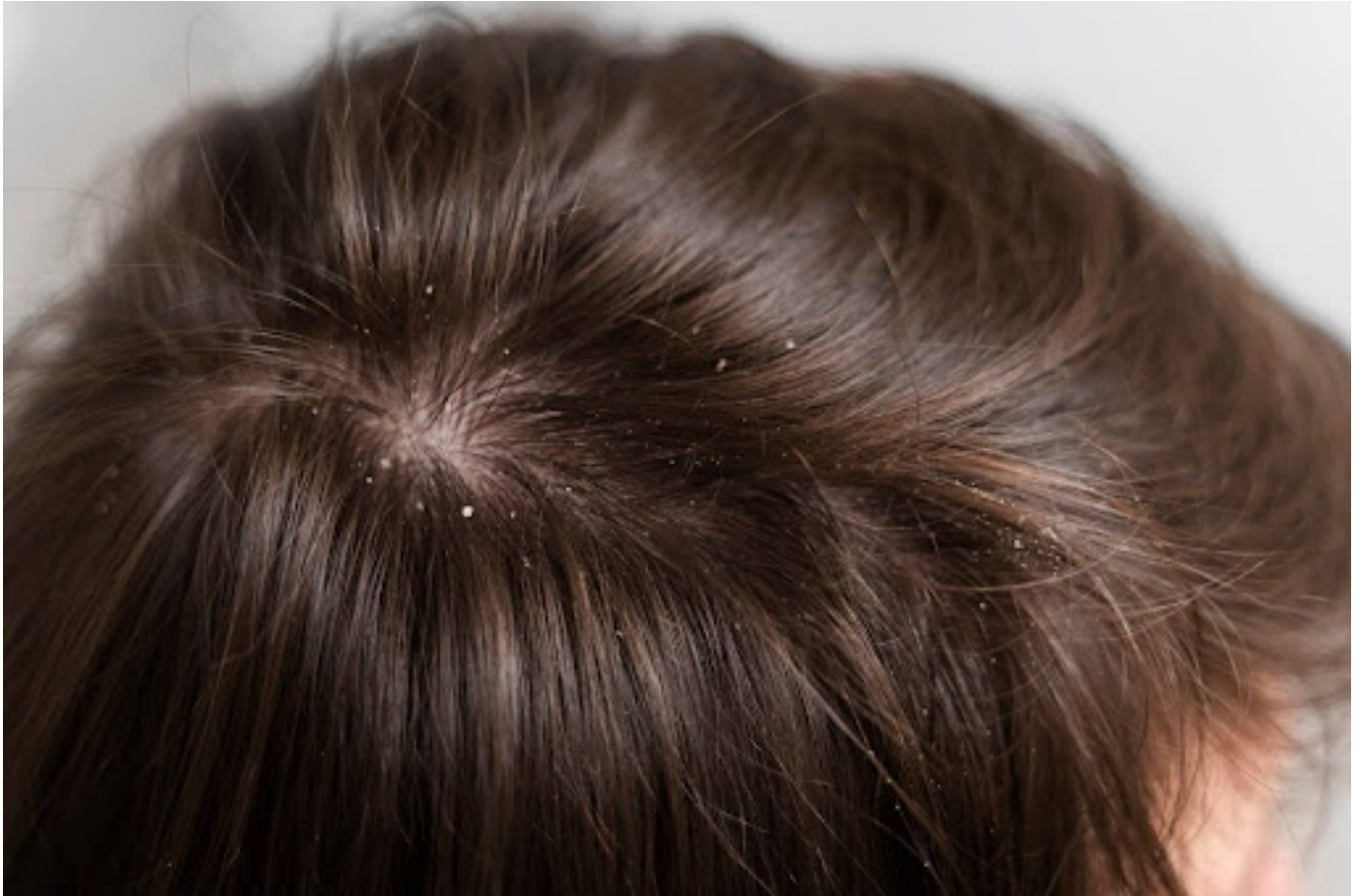
Ilustrasi rambut berketombe