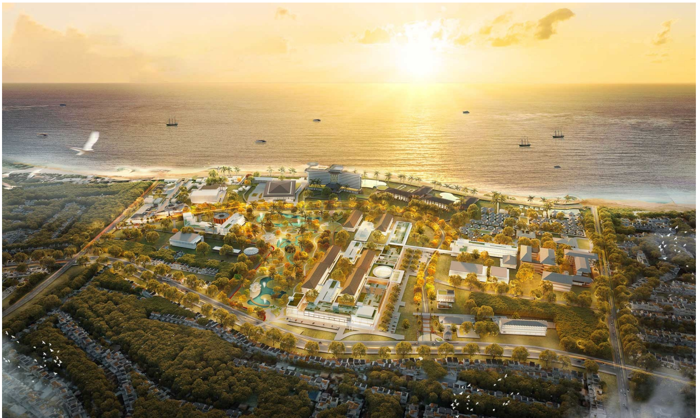
Ilustrasi Kawasan Ekonomi Khusus – aecom

Dengan investasi yang telah mencapai Rp140 triliun pada 2023 dan penyerapan tenaga kerja sebanyak 86.273 dari 318 pelaku usaha, Kawasan Ekonomi Khusus menjadi motor utama dalam memacu pertumbuhan ekonomi regional dan nasional.