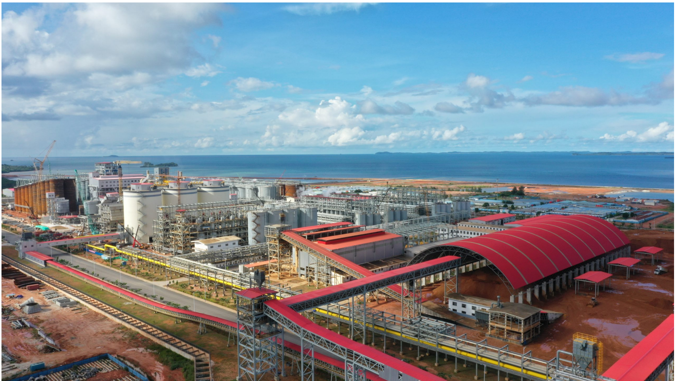
Kawasan Ekonomi Khusus Galang Batang – situs resmi Kawasan Ekonomi Khusus

Namun, dengan komunikasi yang baik dan kolaborasi dengan berbagai stakeholder, tantangan-tantangan tersebut dapat diatasi.