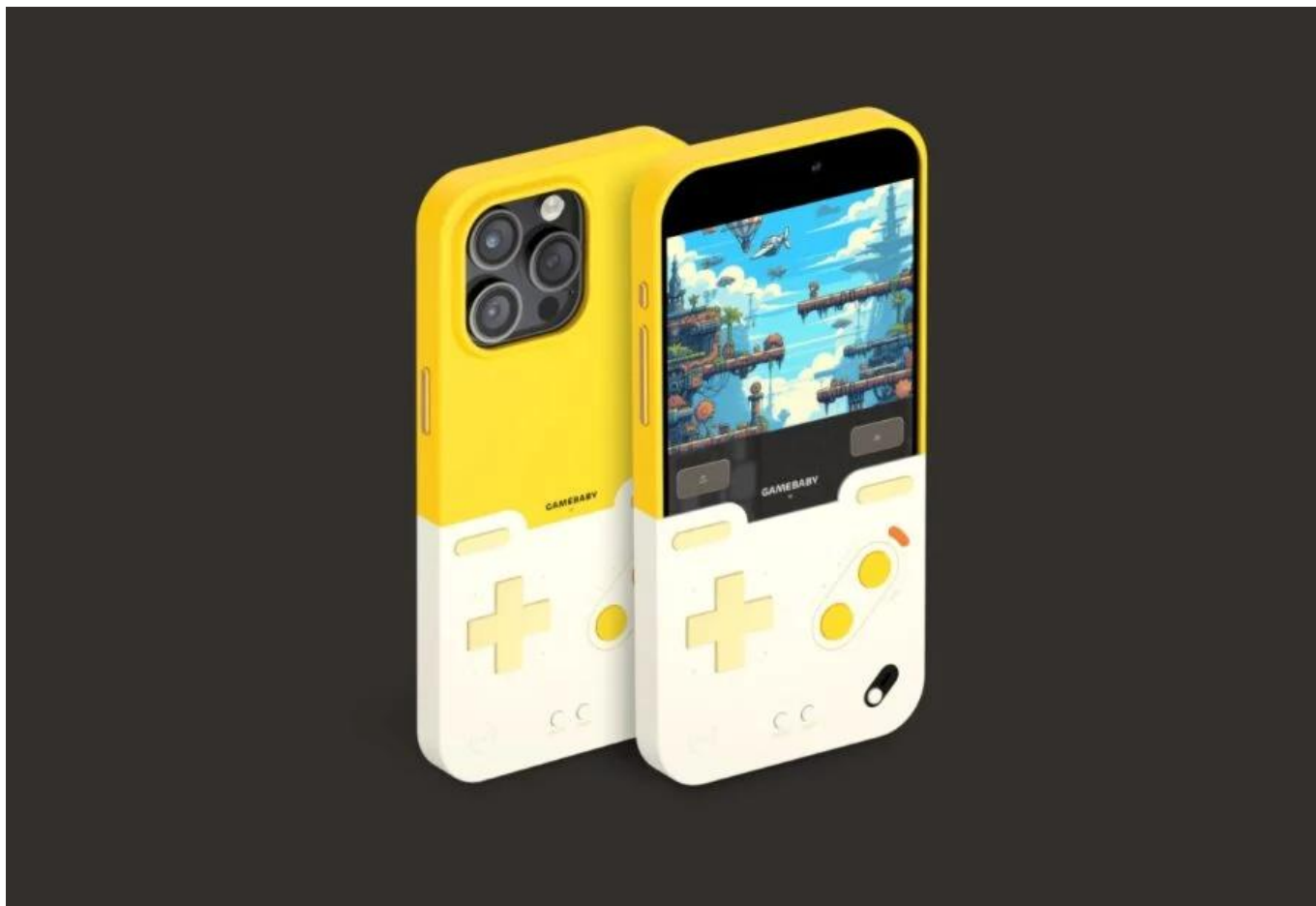
GameBaby dari Bitmo Lab - Bitmolab

Kangen Main Game Boy? Yuk, Ubah iPhone Kamu dengan GameBaby dari Bitmo Lab!