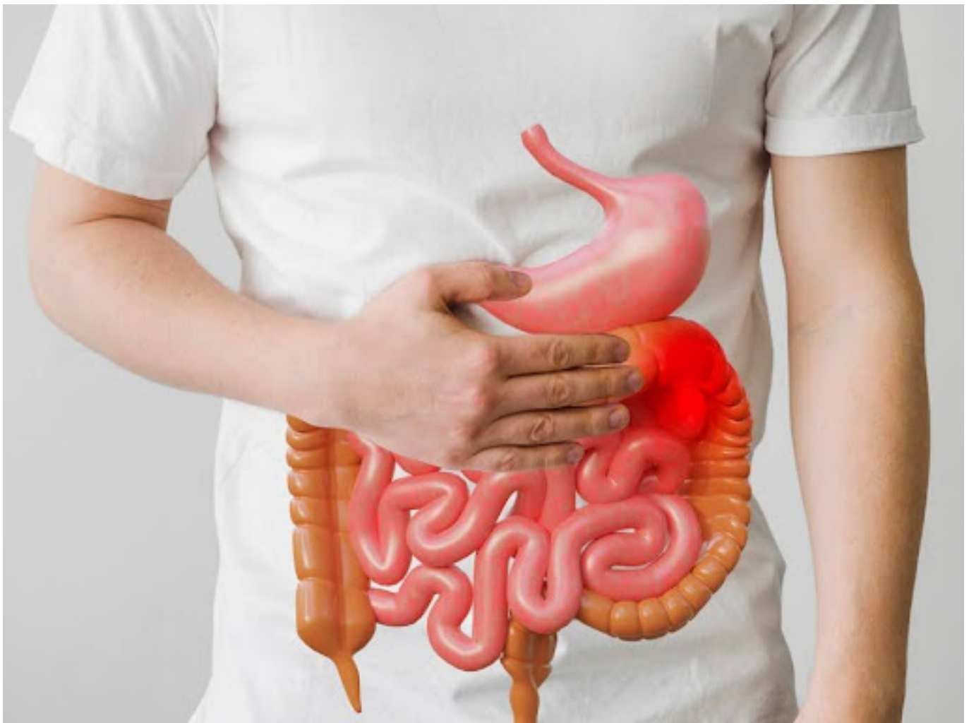
Ilustrasi gangguan pencernaan

Konsumsi petai secara berlebihan dapat mengganggu keseimbangan bakteri di dalam usus dan menyebabkan diare. Hal ini disebabkan oleh kandungan serat yang tinggi dalam petai,