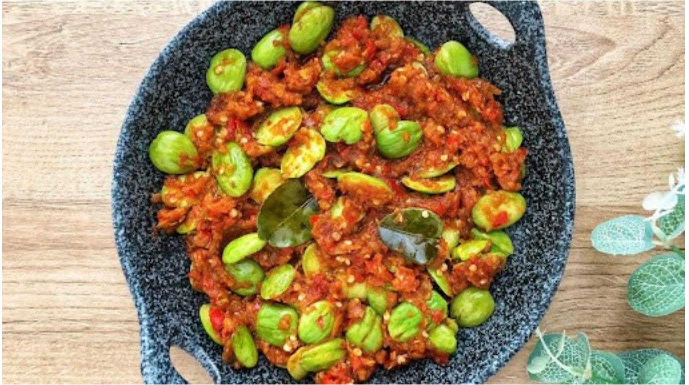
Ilustrasi olahan dari petai