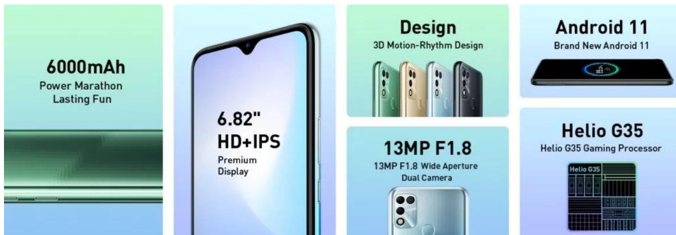
Spesifikasi Infinix Hot 11 Play

Kamera depannya beresolusi 8MP , mampu merekam video dengan kualitas hingga 1080p@30fps , memberikan hasil gambar yang tajam dan jernih untuk selfie dan panggilan video.