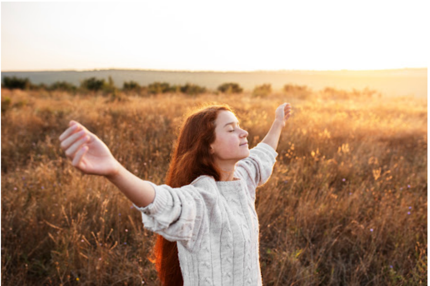
Sebuah ketenangan dalam hidup

“Ikigai” berasal dari bahasa Jepang, di mana “iki” berarti hidup dan “gai” berarti nilai. Secara harfiah, ini dapat diartikan sebagai nilai hidup atau alasan untuk hidup.