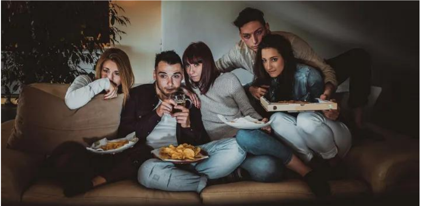
Portal Seja Luz

Yang terakhir, meskipun horor identik dengan kengerian, tapi banyak juga pesan moral dan pelajaran hidup berharga yang bisa kamu dapetin dari film atau buku genre ini.