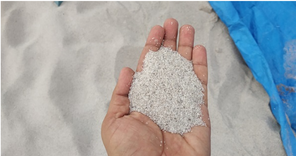
Pasir Silika - stellamariscollege

Pasir silika memiliki banyak manfaat dalam industri, mulai dari kebutuhan industri gelas, semen, beton, hingga kosmetik dan elektronik.