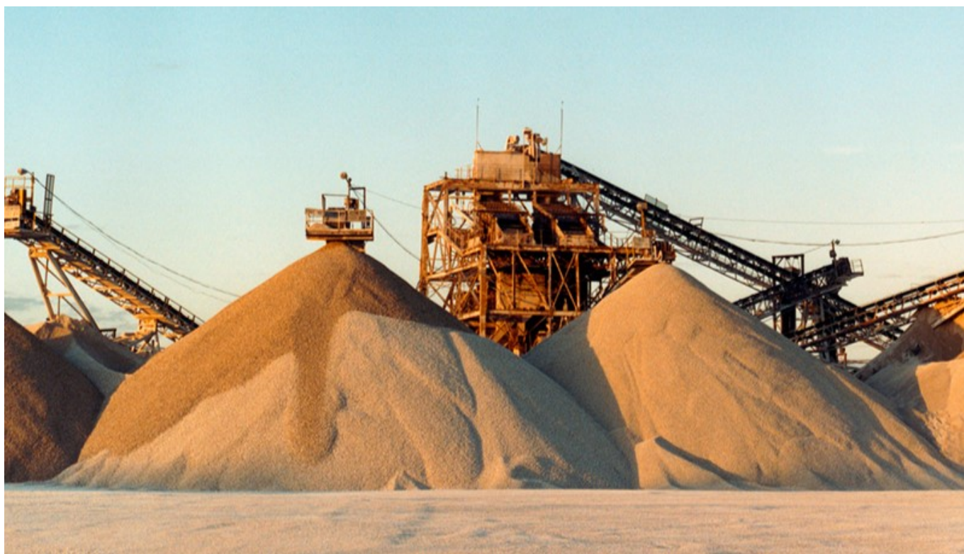
Pertambangan Silika - abisatyaabadimining

Hilirisasi silika menjadi wafer silikon dinilai dapat mendukung kemandirian industri photovoltaic (PV) module dan semikonduktor di Indonesia. Wafer silikon memiliki peran penting sebagai material utama bagi industri semikonduktor dan sel surya.