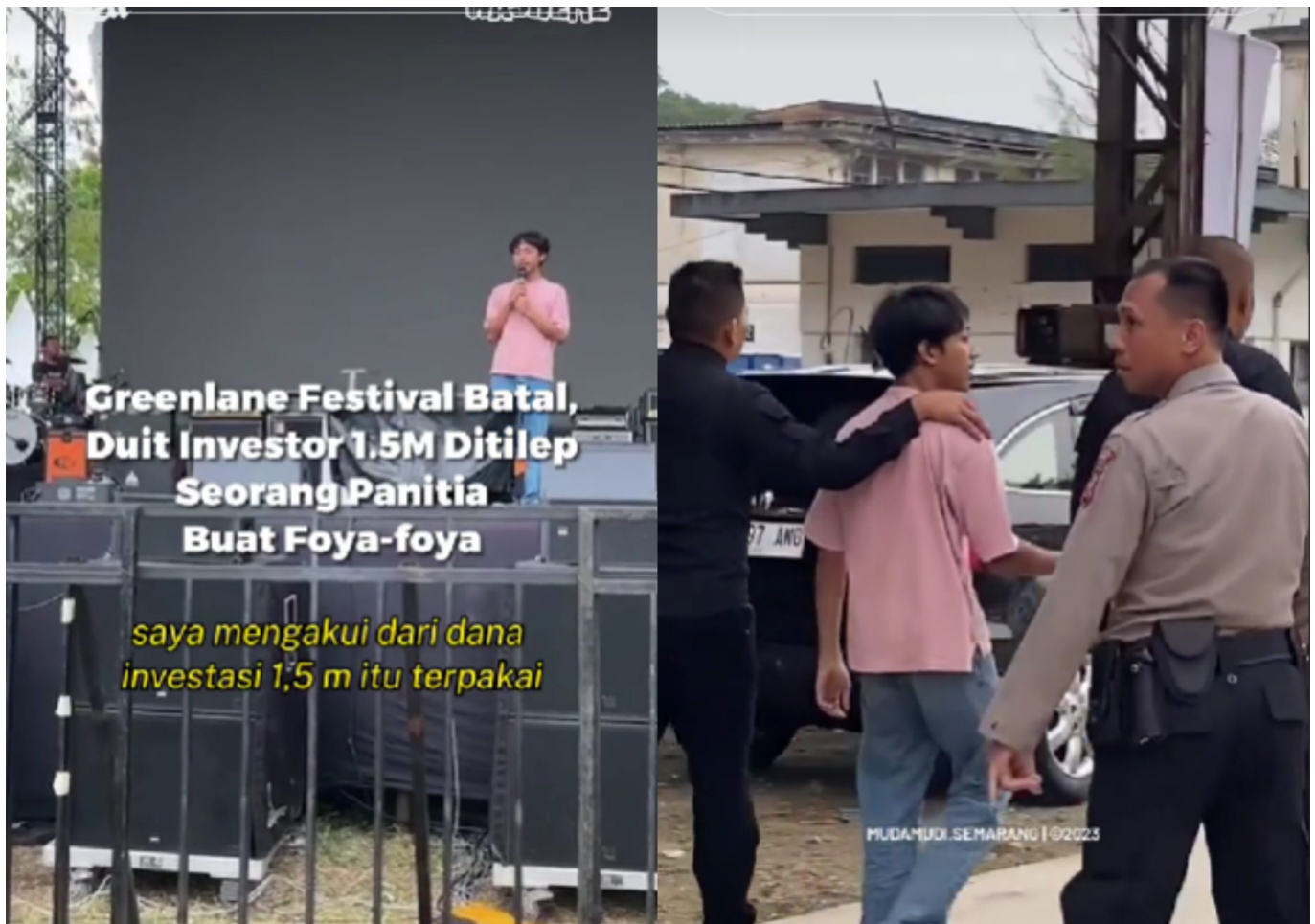
Potret oknum yang telah menggelapkan dana Greenlane Festival – temanmain

Selain itu, ada juga informasi mengenai seseorang yang diduga menjadi penyebab pembatalan acara tersebut. Seorang pria dengan inisial BR diduga telah memanfaatkan dana investasi untuk keperluan pribadinya.