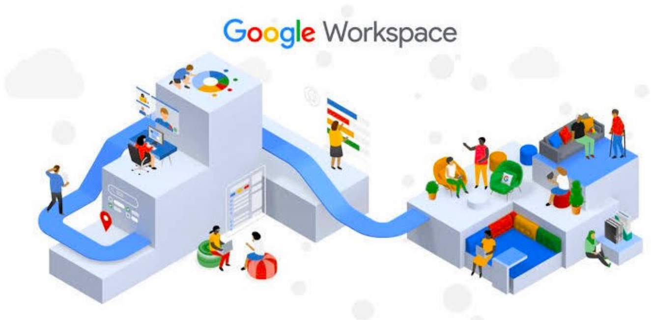
Ilustrasi Google Workspace - elitery

Google telah menambahkan banyak fitur ke Workspace, seperti Duet AI, yang membawa bantuan AI ke suite kerja kantornya (meskipun itu akan dikenakan biaya sekarang), atau fitur yang lebih biasa seperti dukungan eSignature asli.