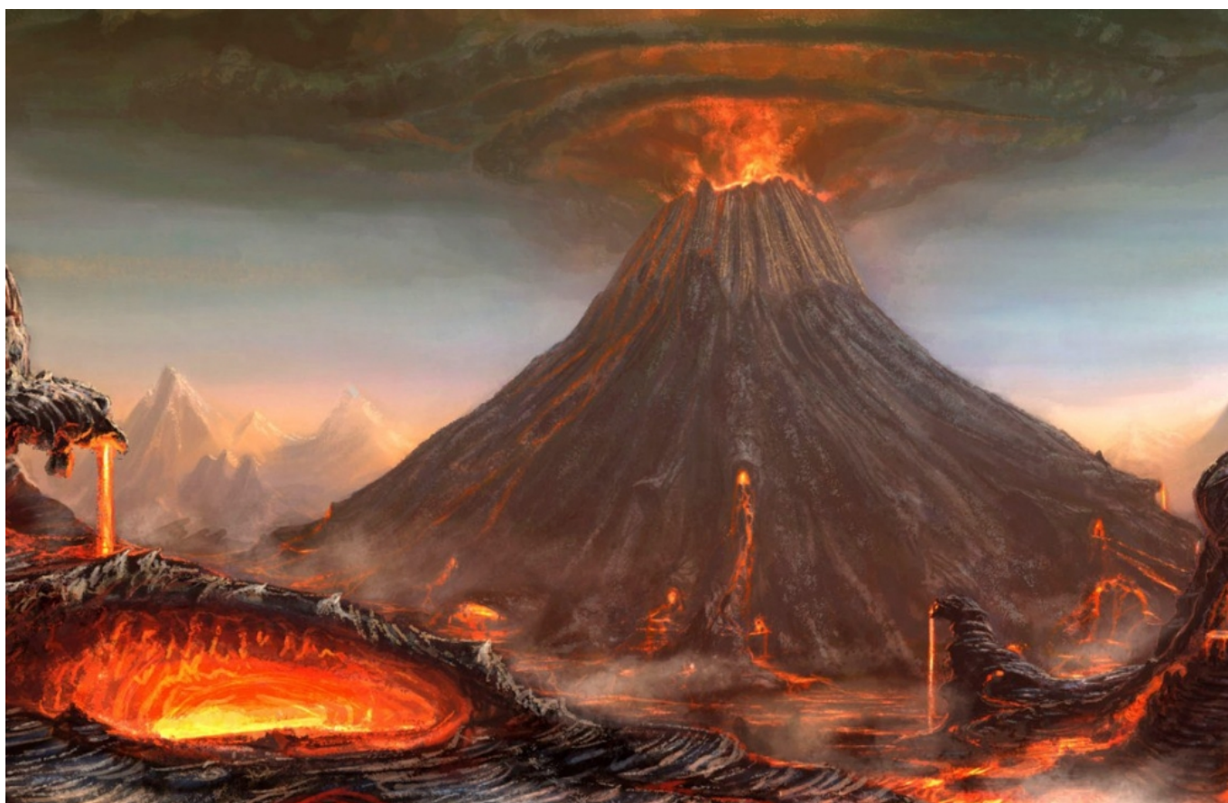
Ilustrasi Gunung Toba

Danau ini sebenarnya merupakan kaldera yang terbentuk akibat erupsi besar gunung berapi di kawasan tersebut.