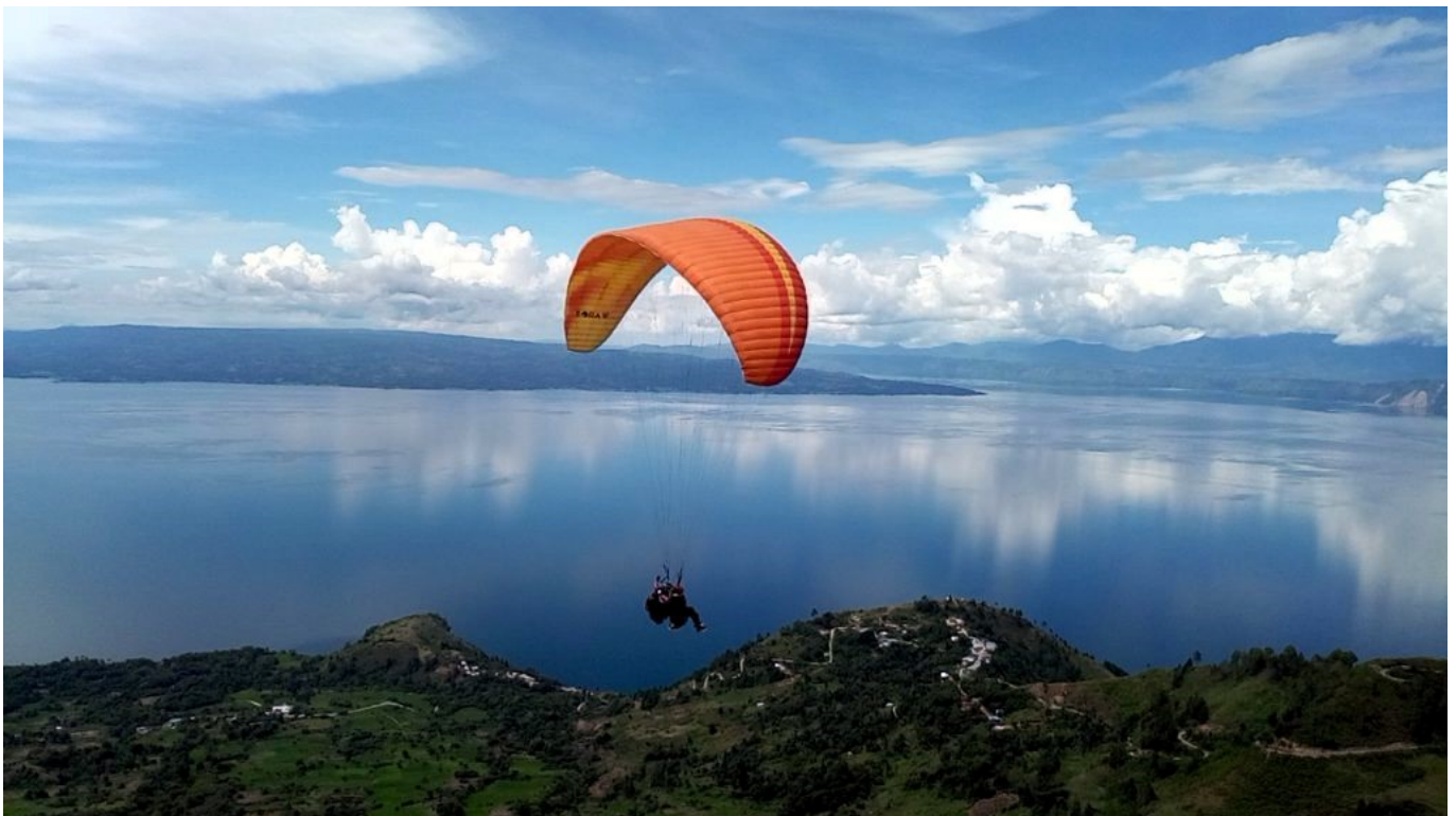
Paralayang Huta Ginjang

Toba memang menjadi daya tarik utama bagi banyak wisatawan, berkat beragam atraksi dan keajaiban alam yang menakjubkan yang ditawarkannya.