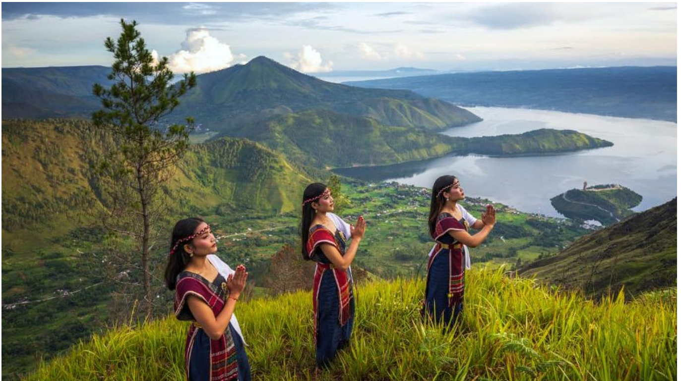
Suku Etnis Batak Toba

Pulau Samosir bukan hanya tempat tujuan wisata terkenal, tetapi juga merupakan tempat tinggal suku etnis Batak Toba, yang merupakan salah satu suku Pribumi di kawasan tersebut.