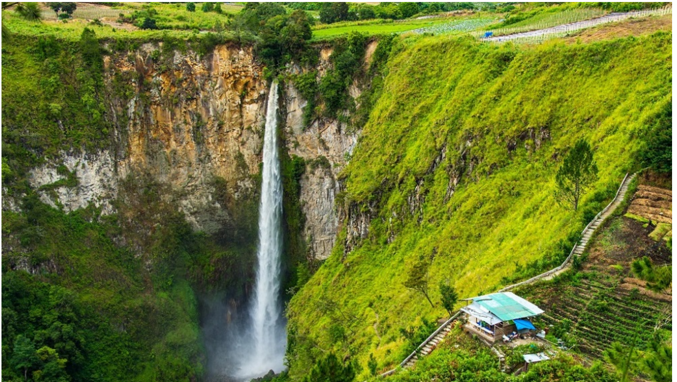
Air Terjun Sipiso-Piso

Bagi mereka yang lebih menyukai aktivitas air, pantai dan permainan kayak di sepanjang danau merupakan pilihan yang menarik.