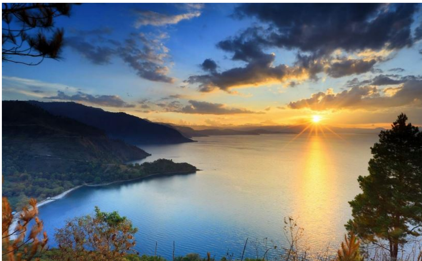
Keindahan Danau Toba

Tak dapat disangkal, keindahan Danau Toba di Sumatera Utara memukau setiap mata yang memandang, menjadikannya salah satu destinasi wisata terkemuka di Indonesia.