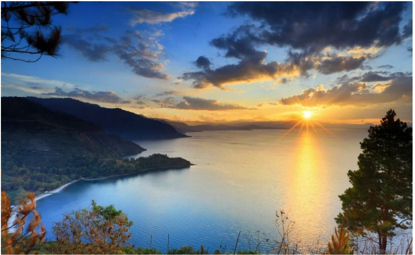
Keindahan Danau Toba

Tak dapat disangkal, keindahan Danau Toba di Sumatera Utara memukau setiap mata yang memandang, menjadikannya salah satu destinasi wisata terkemuka di Indonesia.