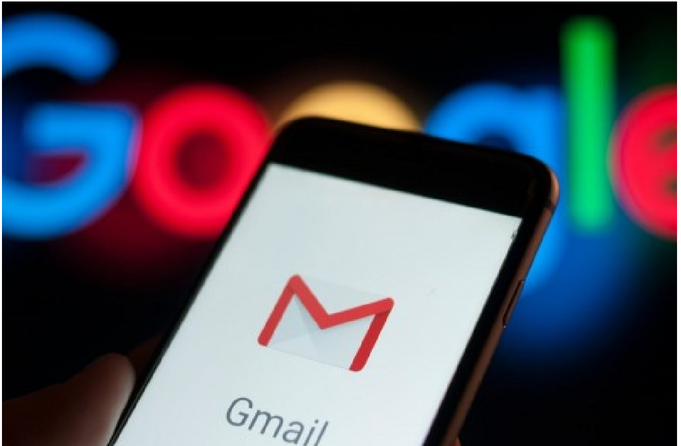
Gmail - medcom

Namun, seperti yang dilaporkan oleh The Register pada tanggal 25 September, Google telah memutuskan untuk menghentikan layanan tersebut.