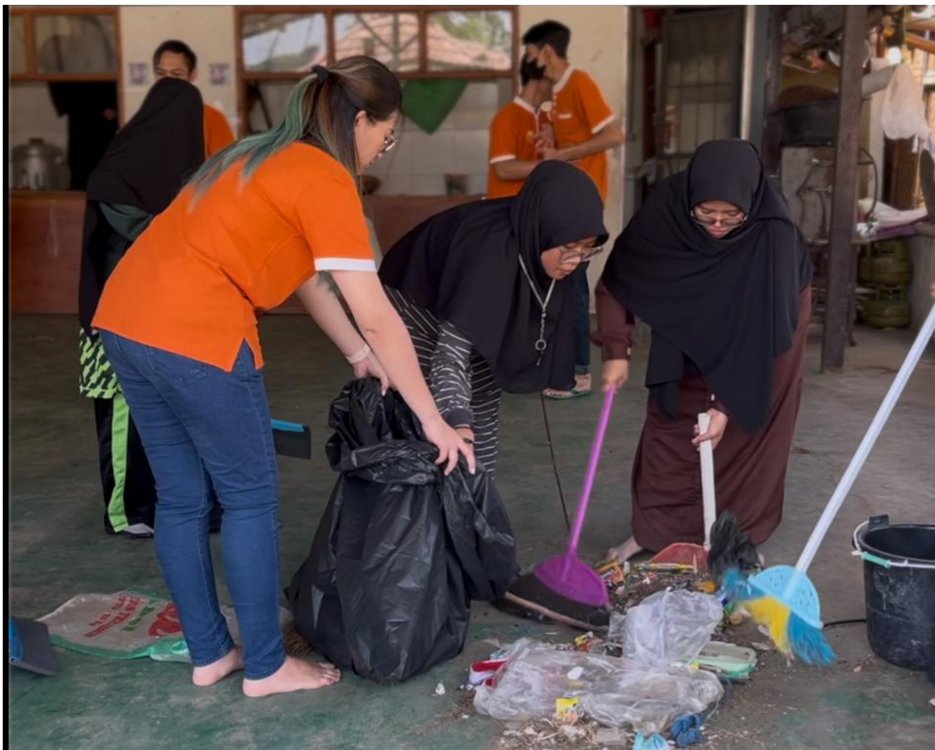
dok Harris Hotel

Acara “Bersama Bersih-Bersih Mesjid” dipilih menjadi tagline untuk Gerakan World Cleanup day tahun ini, acara yang dilaksanakan pada hari Rabu, 17 September 2024 ini bertempat di Pesantren Awaliyah Qur’an. Pesantren yang bersama-sama dipilih oleh Harris Festival Citylink Bandung dan Tim Explore Humanity ini dinilai membutuhkan bantuan khususnya untuk kebersihan, karena di Pesantren Awaliyah Qur’an memiliki sekitar 80% anak-anak didiknya merupakan anak-anak yatim dan piatu juga warga sekitar yang kurang mampu. Pesantren Awaliyah Qur’an juga selama bertahun-tahun memberi sumbangsih untuk warga sekitar