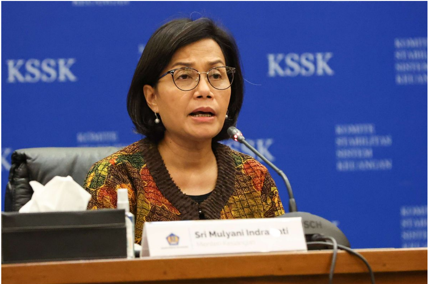
Menteri Keuangan Sri Mulyani Indrawati.

Sebagai informasi tambahan, Presiden Joko Widodo (Jokowi) telah mengumumkan rencana kenaikan ini bagi aparatur sipil negara (ASN) hingga para pensiunan dalam pidato Rancangan Undang-Undang Anggaran Pendapatan dan Belanja Negara (RUU APBN) pada tanggal 16 Agustus 2023 silam.