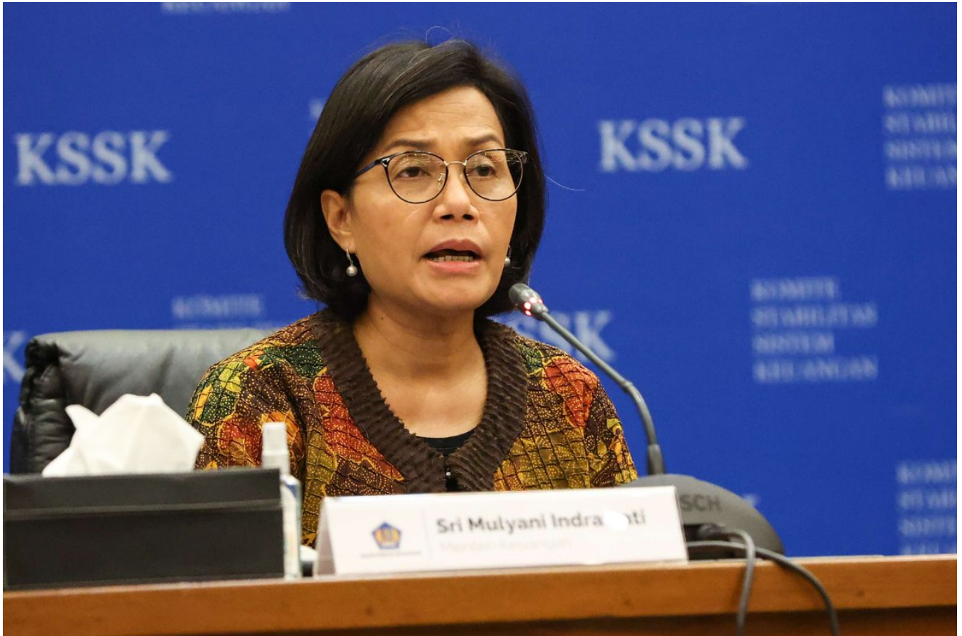
Menteri Keuangan Sri Mulyani Indrawati (Kompas).

Sebagai informasi tambahan, Presiden Joko Widodo (Jokowi) telah mengumumkan rencana kenaikan ini bagi aparatur sipil negara (ASN) hingga para pensiunan dalam pidato Rancangan Undang-Undang Anggaran Pendapatan dan Belanja Negara (RUU APBN) pada tanggal 16 Agustus 2023 silam.