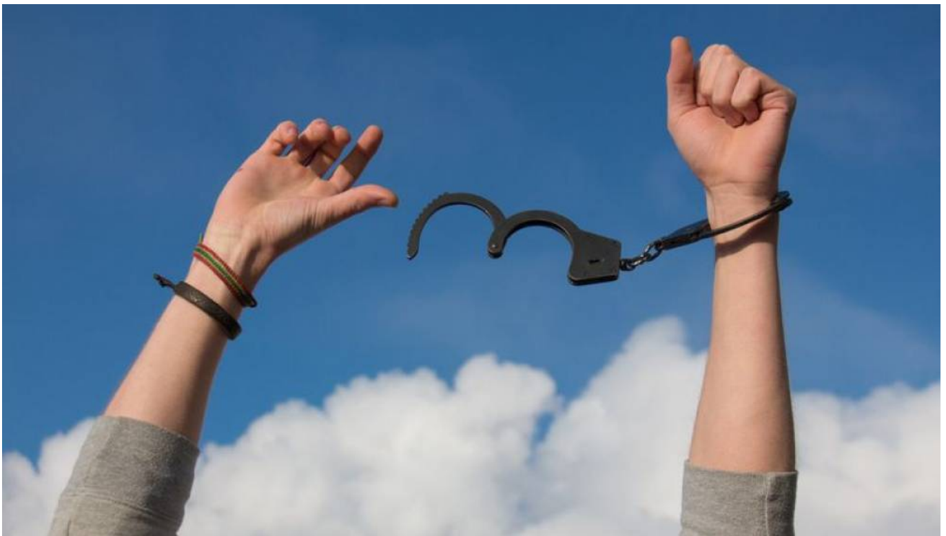
Ilustrasi melepaskan borgol yang merepresentasikan beban

Nah, itu dia, guys! Emotional Freedom Techniques memang terdengar simpel, tapi jangan salah, teknik ini bisa jadi game-changer buat kesejahteraan emosional dan fisik kamu.