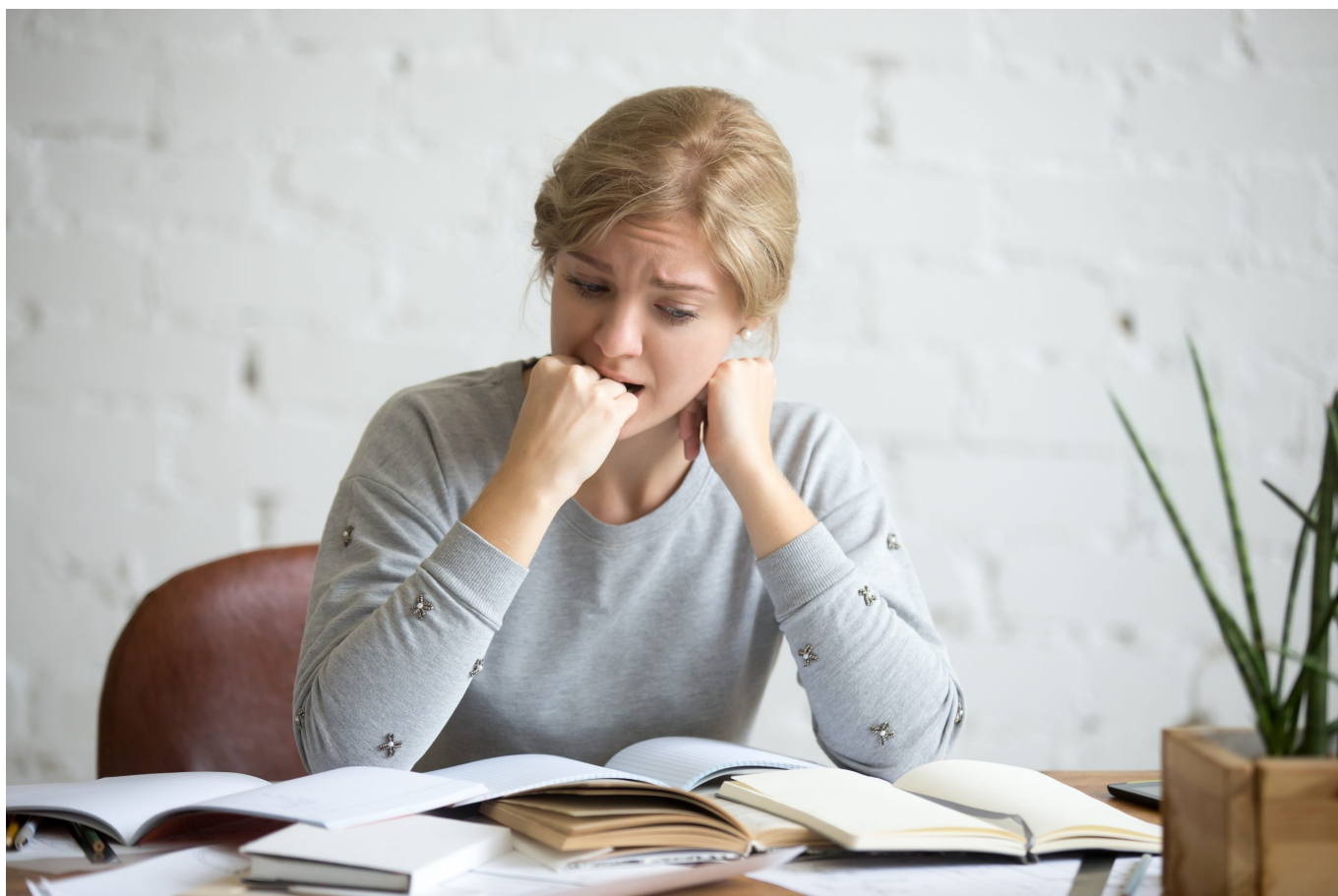
Ilustrasi seseorang yang mengalami kecemasan

Sekarang, kenapa kamu harus mencoba Emotional Freedom Techniques? Berikut adalah beberapa manfaat yang bisa kamu rasakan: