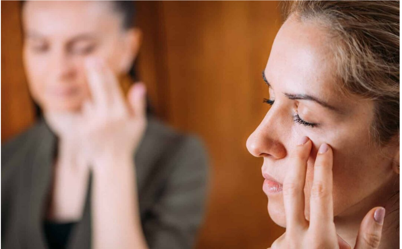
Ilustrasi tapping

EFT atau Emotional Freedom Techniques adalah metode self-healing yang menggabungkan konsep akupunktur tanpa jarum dengan prinsip-prinsip psikologi.