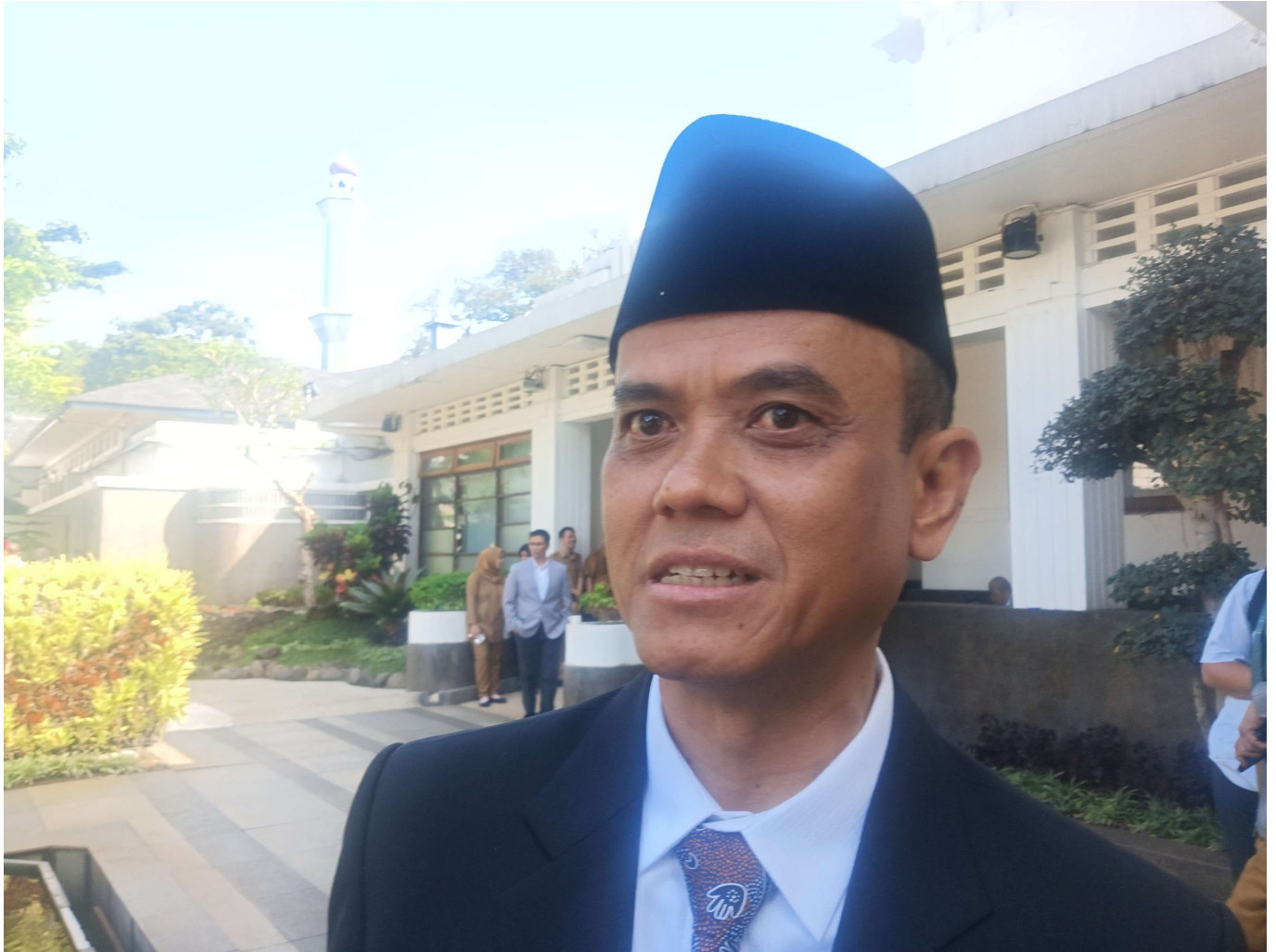
Kepala Dinas Pendidikan Kota Bandung, Asep Saeful Gufron (RRI).