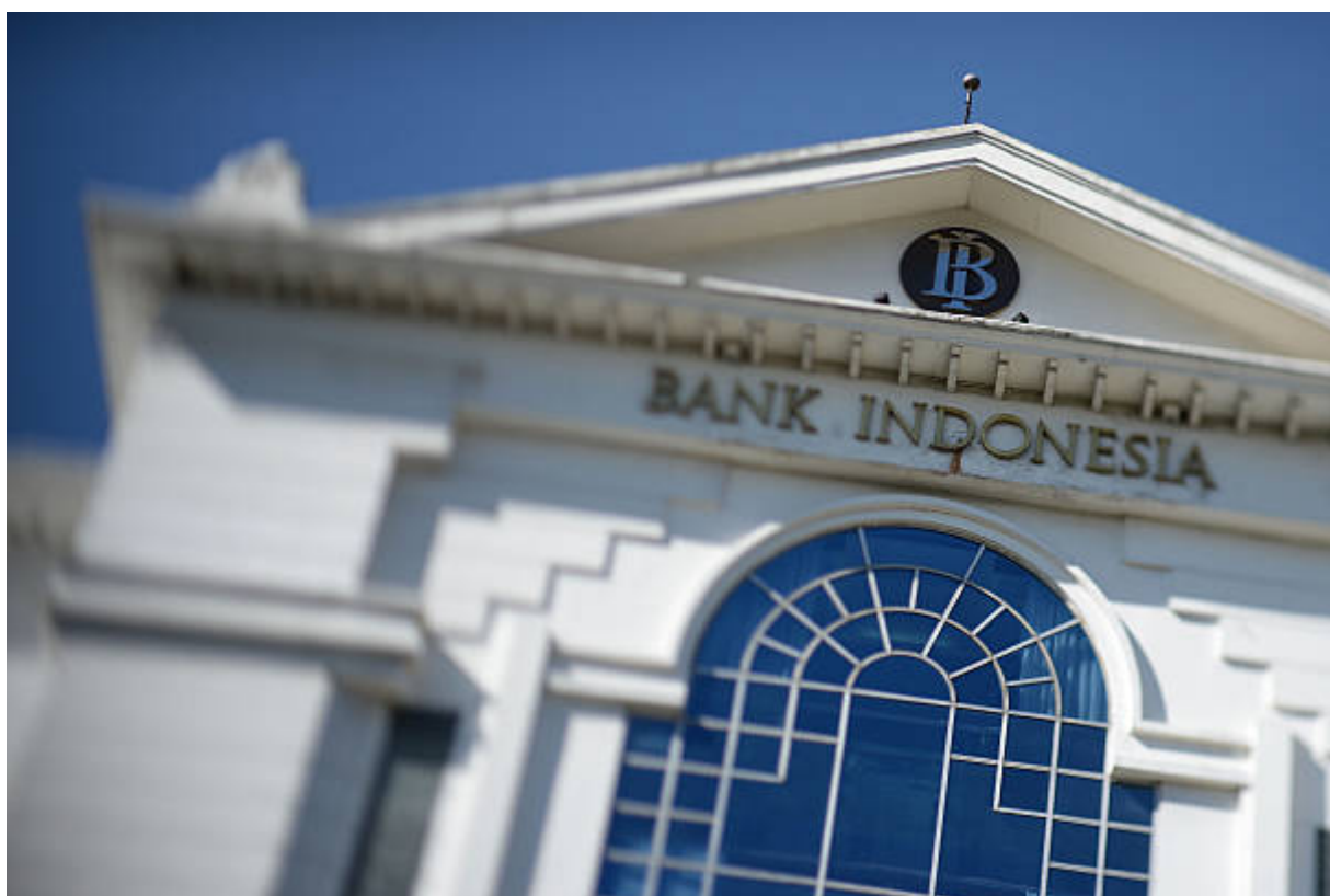
Potret Bank Indonesia

Mengoptimalkan strategi kebijakan campuran menjadi salah satu langkah yang diambil untuk mendukung pemulihan ekonomi yang berkelanjutan.