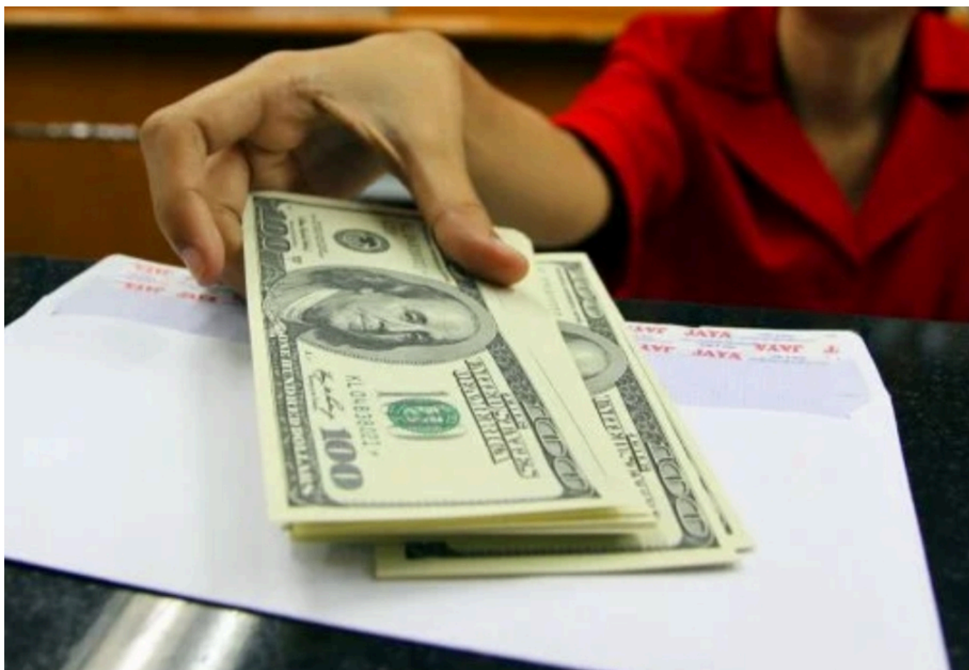
Ilustrasi modal asing

Menganalisis lebih lanjut tentang aliran modal asing, terutama pada Minggu IV Oktober 2023, Premi CDS Indonesia untuk jangka waktu 5 tahun tercatat sebesar 100,71 bps per tanggal 26 Oktober.