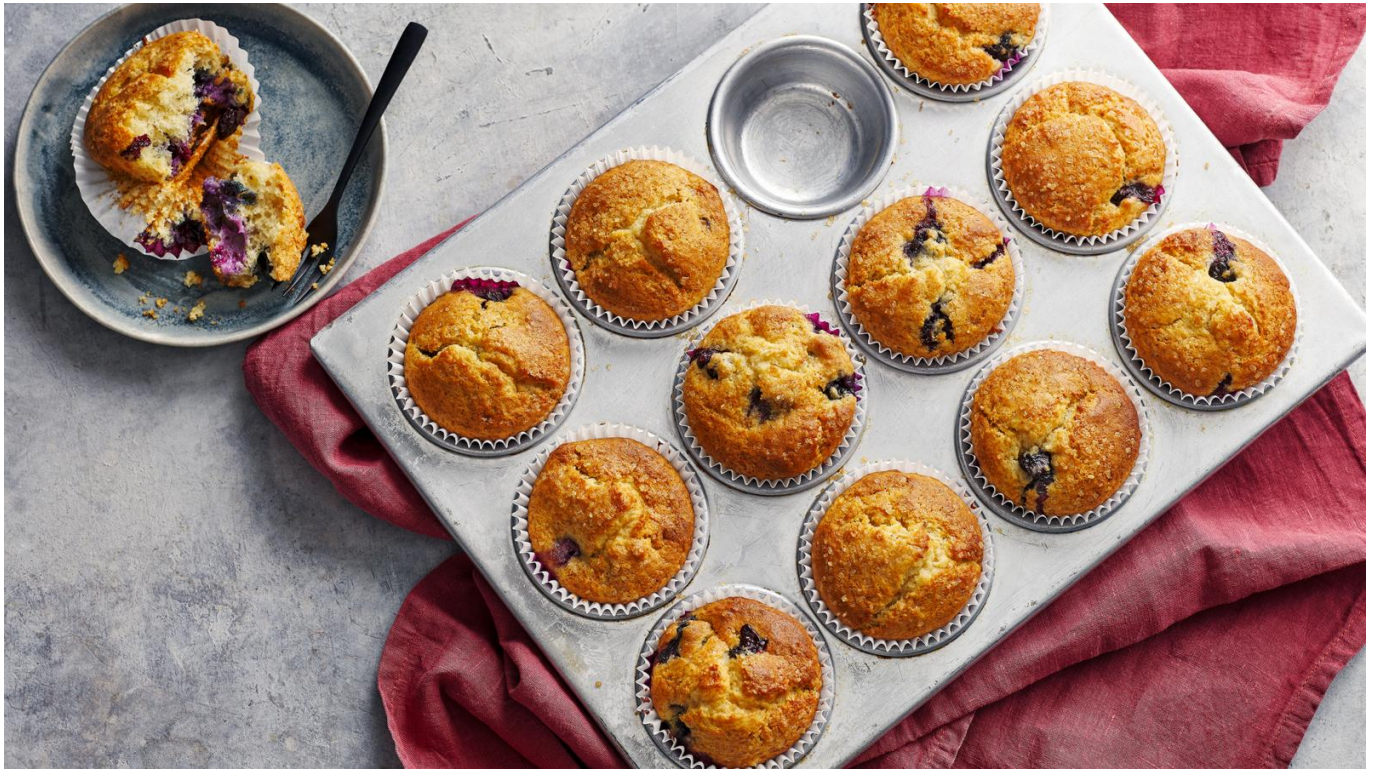
Dietary Restriction Desserts

Baca Juga: Pusing Sama Matematika? 8 Aplikasi Belajar Matematika Ini Bikin Soal Sesulit Apapun Jadi Gampang!